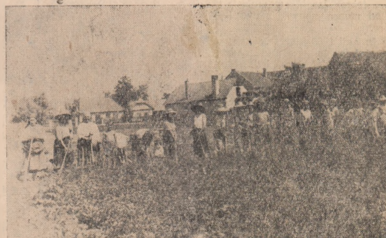
Paralel cu lucrările de întreținere, la G.A.C. Oarda de Jos se recoltăză cartofii de vară, vederea reînsămînțării terenului.

Și au dreptate oamenii exprimîndu-se astfel. Ales deputat, de a fost treabă grea sau ușoară, tovarășul