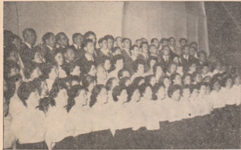
Cîntă corul Casei raionale de cultură.