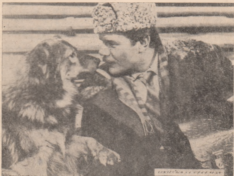
În aceste zile, la cinematograful „Victoria” din orașul nostru rulează filmul „Lovitura de pedeapsă” o producție a studiourilor sovietice.