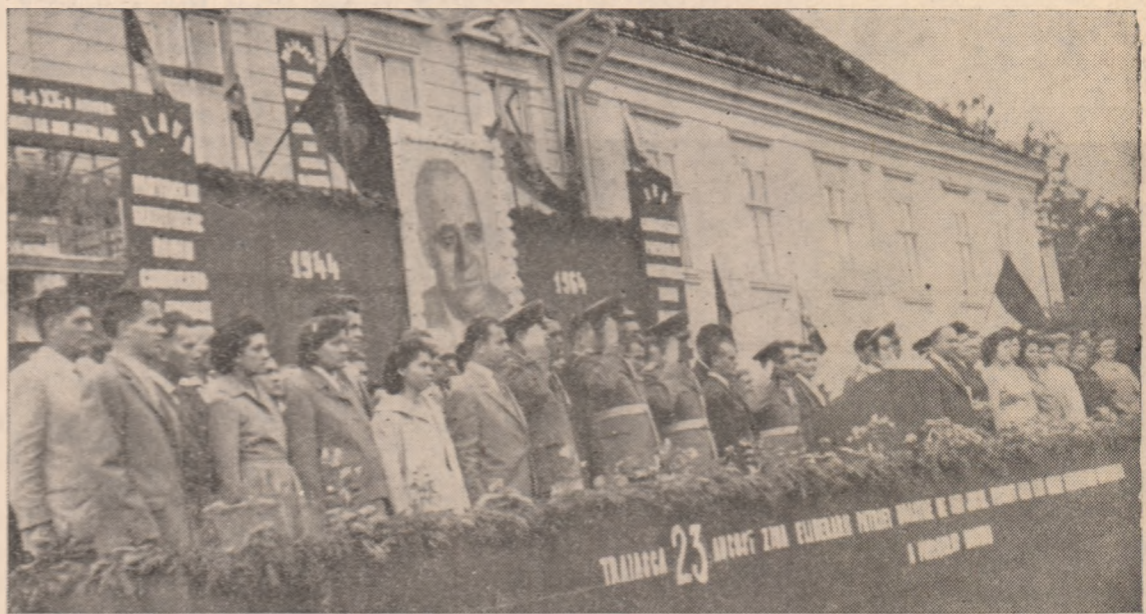
Aspect de la tribuna oficială în timpul mitingului.