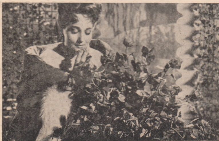
ÎN CLIȘEU: Scenă din filmul cehoslovac „Rusalca” ce rulează la cinematograful „23 August” între 3-6 septembrie.