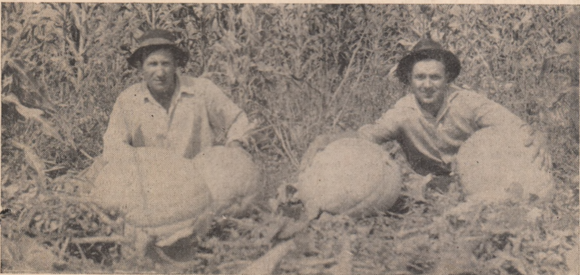
La G.A.C. Bucerdea Vînoasă decivicii furajeri îngrijiți bine au ajuns la 50-60 kg fiecare.