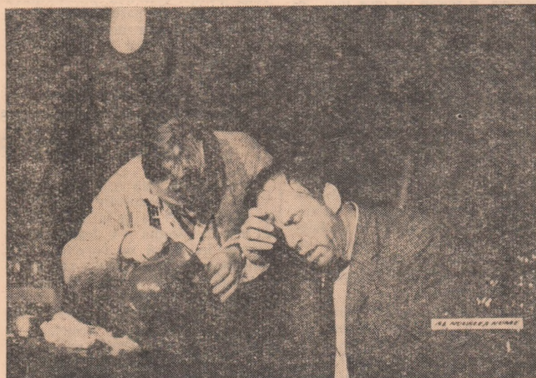
În curînd, pe ecranul cinematografului „Victoria“ din Alba Iulia va rula filmul cehoslovac „Al nouălea nume“.

șeful secției hortic-viticole Consiliul agricol raional Alba