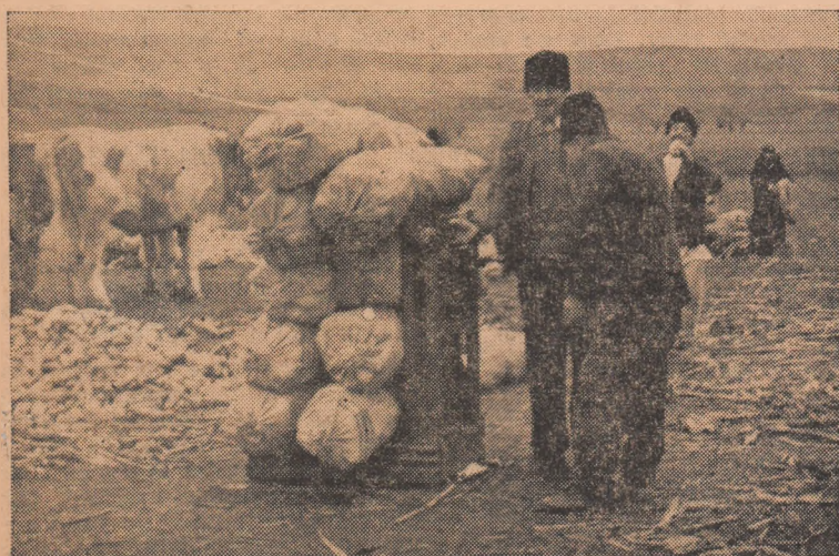
Bucuria colectivizatorilor din Cricău este justificată. În aceste zile primesc avansul de porumb pentru zilele muncă efectuate.

Cunoscînd avantajele muncii în comun, avînd create condiții favorabile pentru sporirea producției agricole și realizarea unor venituri mari, prin folosirea chibzuită a sprijinului acordat din partea statului în tractoare și mașini agricole, semințe de soi și altele, colectivizatorii din Cricău, sub îndrumarea comitetului de partid încă de la începutul anului au pornit hotărîți la muncă