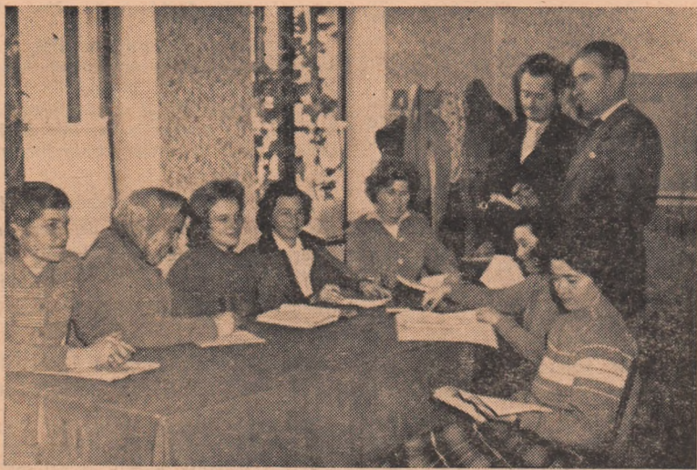
Activiștii culturali din Oarda de Jos discută planul de muncă al căminului cultural pe perioada de iarnă.

Dar, despre faptul că activiștii culturali din Oarda de Jos au pornit pe un drum bun, nu vorbește numai planul de muncă, ci și acțiunile întreprinse pînă acum. Așa, de exemplu, aici au și fost prezentate conferințele „Îngrijirea culturilor în timpul iernii” și „Prepararea nutreturilor grosiere”. Brigada artistică de agitație a prezentat, nu de mult, un program nou, iar echipa de teatru a început pregătirile în vederea participării la cel de al IV-lea festival de teatru „I.L. Caragiale”. Alte și alte manifestări sînt, de asemenea, în pregătire fiecare cadru didactic, fiecare activist cultural avînd sarcini concrete bine conturate în munca cultural-educativă și obștească.