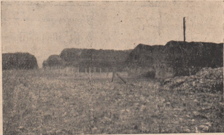
IN CLIȘEU: Un aspect de la depozitul de furaje al gospodăriei colective din Alba Iulia.