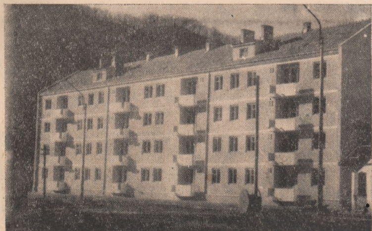
IN CLIȘEU: Noul bloc construit la Zlatna.