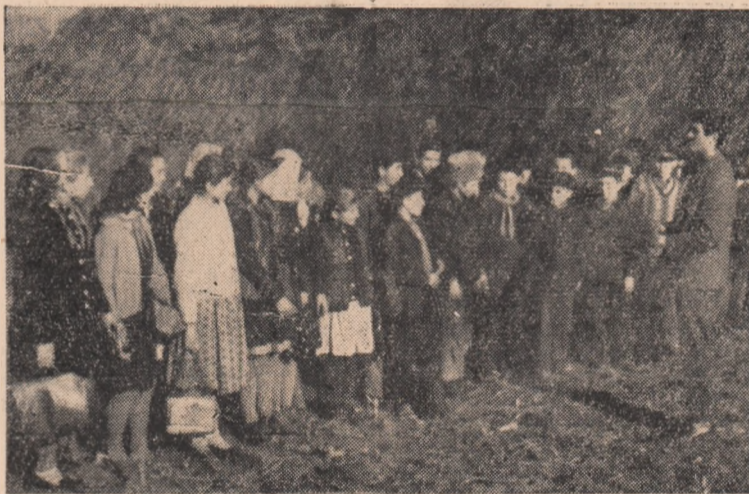
Aplicație practică la obiectul „Agricultură”. Elevii clasei a VII-a a Școlii de 8 ani Ighiu fac recunoașterea furajelor.

Cîstînd memoria marelui nostru povestitor Ion Creangă de la a cărui moarte se împlinesc 75 de ani, la unitățile culturale din oraș, la căminele culturale, bibliotecile comunale și sătești din raion vor avea loc, în cursul lunii decembrie, o seamă de manifestări. Așa, bunăoară, în scopul popularizării personalității scriitorului și a nemuritoare sale opere vor fi organizate peste tot seri literare, montaje, simpozioane și medaliaone literare. În același scop vor fi întocmite liste cu recomandări din opera scriitorului, vor fi organizate expoziții și concursuri cu tema: „Viața și opera lui Ion Creangă”.