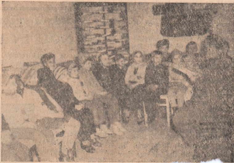
Seară de basm la Biblioteca raională. Cîntecul „Harap Alb” de Ion Creangă.