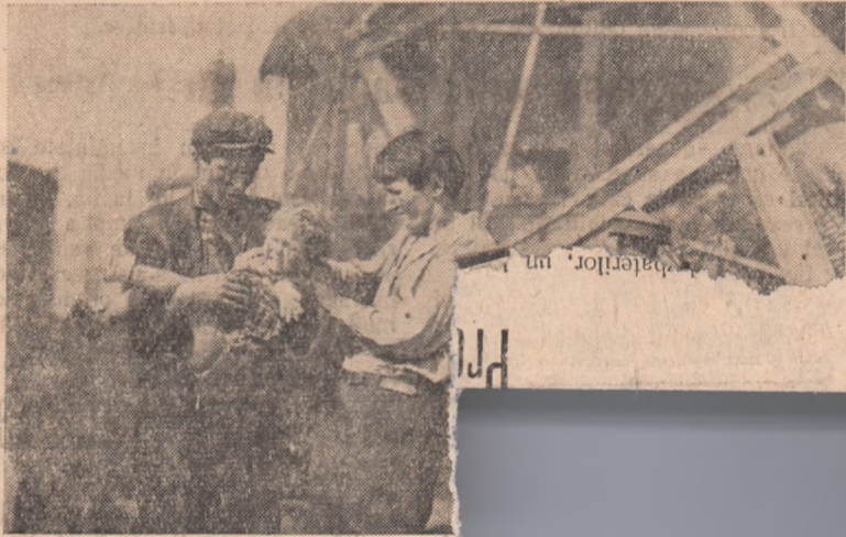
ÎN CLIȘEU: Scenă din filmul zile la cinematograful „Victoria“