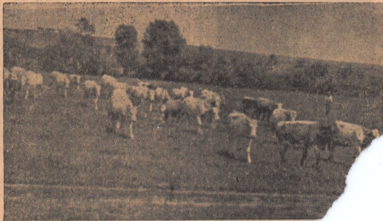
Gospodăria colectivă din Stremț dezvoltă continuu sursă de taurine. În CLIȘEU: Se poate vedea o parte din taurine.

Cazuri cînd lecțiile nu sînt ținute la zi mai sînt și în alte părți. Așa este de exemplu la gospodăria colectivă din Galtiu, Mihalț, Henig și altele unde pînă la data de 17 decembrie nu s-a ținut decît cîte o singură lecție. Consiliile de conducere împreună cu lectorii trebuie să ia măsuri urgente pentru a se ajunge la zi cu lecțiile.