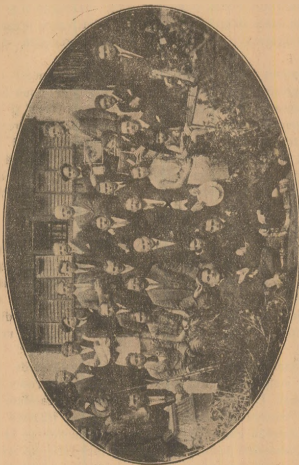
Comisiunea de examinare și absolvenții cursului apicol.

vară? Vin dragă, vin, numai să-i primiți bine! D-zeu să-i aducă Domnule Director, ca să ne mai cânte în biserică și să ne mai facă vre-o zi de veselie.