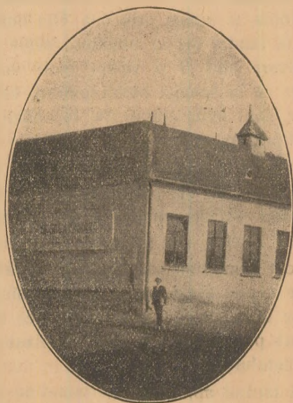
Un colț al școlii unde s'au ținut cursul teoretic.