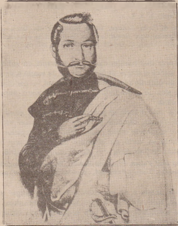
AVRAM IANCU după desenul făcut de I. Costandea , Sibiu.

(Vezi George Barițiu , Părți alese din istoria Transilvaniei pre două sute de ani din urmă. Vol. II. Sibiu 1890, editura autorului pag. 163—164).