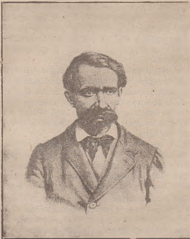
Avram Iancu în anul 1870.

trâna preteasă după ea. Imi spuneă tatăl meu, că la fiecare popas mamă-sa trimiteă oficerilor excortei câte un galbin, ca să mai ușureze soarta prizonierilor. Oficerii primeau bucuros banul, dar robii nu simțiau nici o schimbare în bine. Din Gherla, fiind goală și de bani și de alimente, bunica adânc mähnită trebuł în fine să se întoarcă acasă, iar tatăl și unchiul