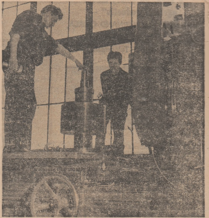
Tineri centrînd la freză o roată de sincronizare de la motorul Diesel

Trecînd de la faza de propagandă la cea de elaborare a unor instrumente concrete de lucru, valorificînd experiența pozitivă a școlii noastre și a in-