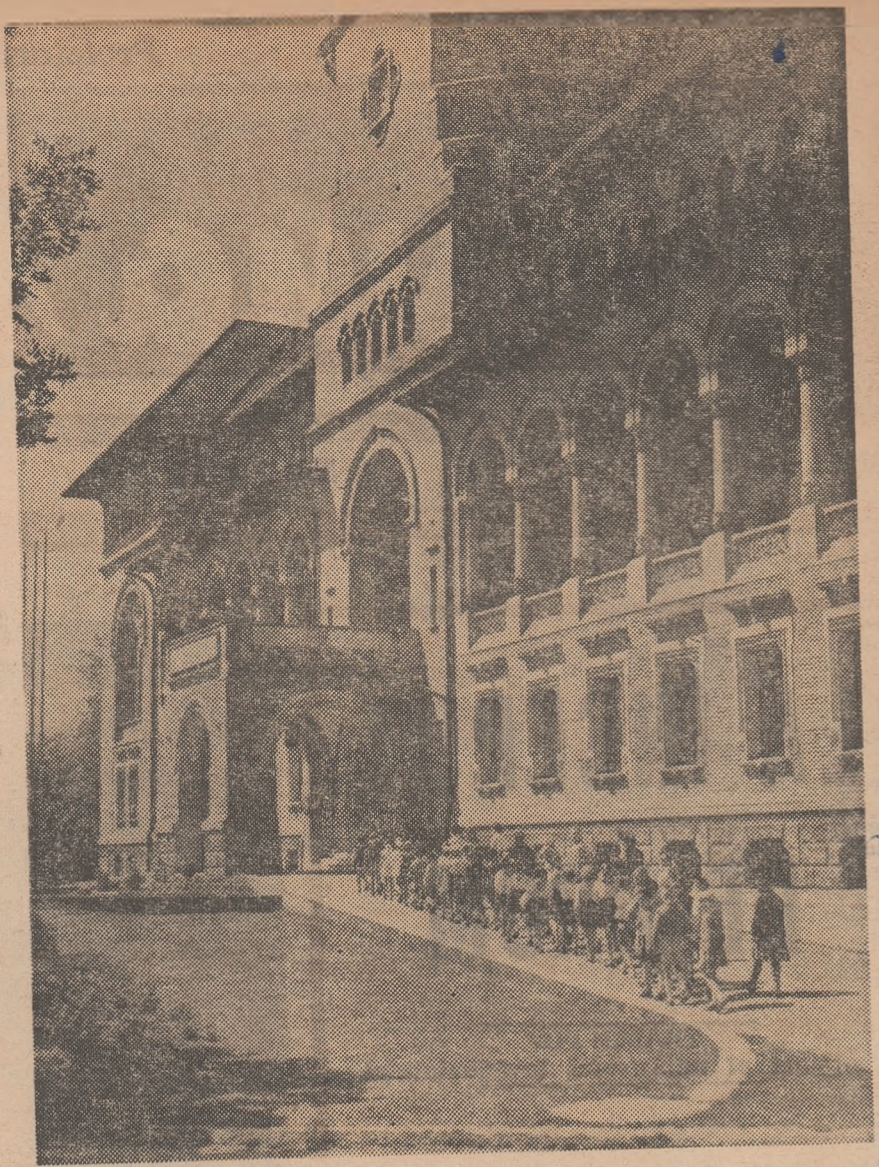
Pionieri în vizită la Muzeul Partidului Comunist al mișcării revoluționare și democratice din România

În toamna lui 1934, mi s-a înscenat un proces de către un consiliu de răz-