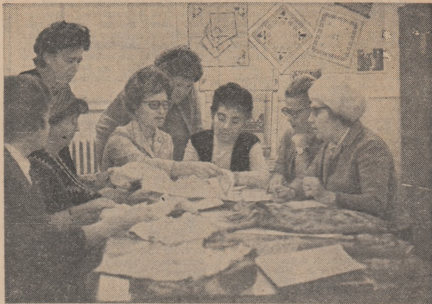
Intr-unul din cabinetele metodice ale Casei corpului didactic din București

caselor corpului didactic, pun în valoare și stimulează activitatea științifică literară și artistică a învățătorilor și profesorilor, dau noi fundamente statutului profesional și intelectual al întregului corp didactic.