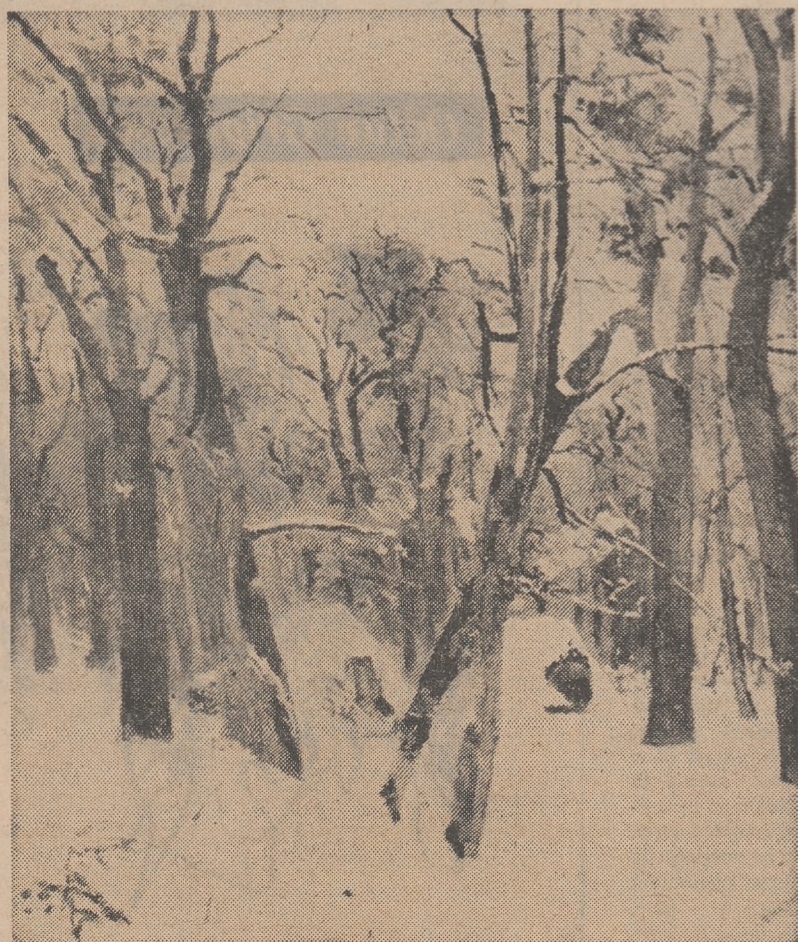
Iarnă în pădure.