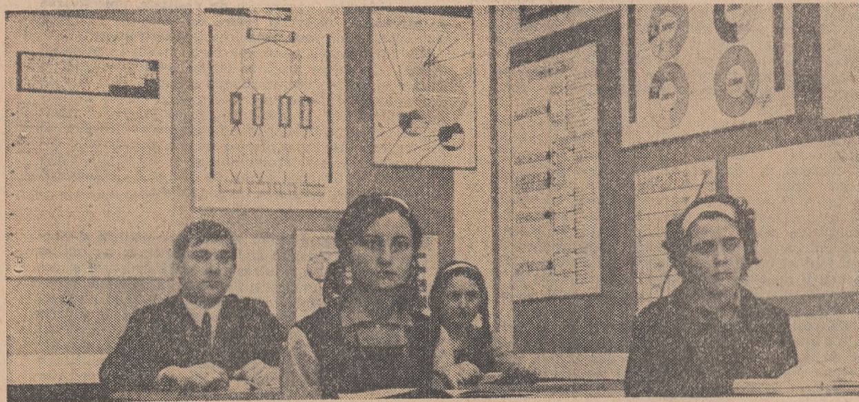
Aspect din Cabinetul de științe sociale al Liceului nr. 3 din Baia Mare,