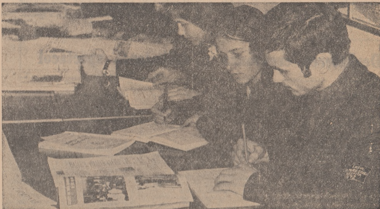
Studiu individual în Cabinetul de științe sociale al Liceului „Andrei Mureșan”, din Bistrița.