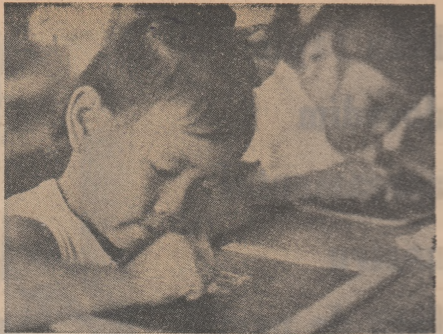
La școală, în zonele eliberate ale Cambodgiei