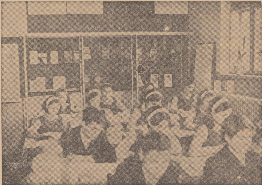
Școala generală nr. 3 din București: în cabinetul de științe sociale, consultînd documentele de partid.