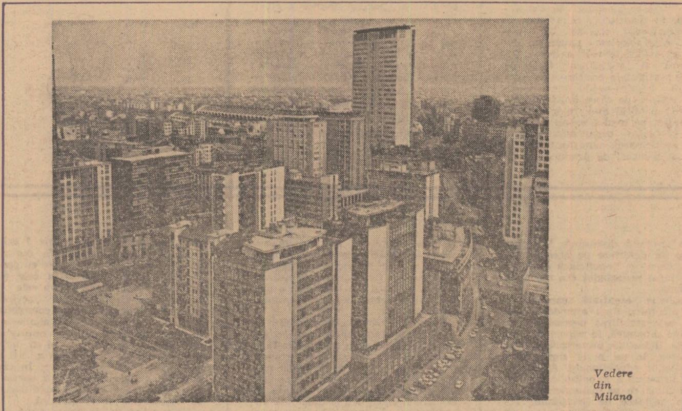
Vedere din Milano

Strădaniile statului pe tărîmul învățământului sînt reflectate, de asemenea, în cheltuielile — bineînțeles, la scara impusă de proporțiile lui — pentru înzestrarea laboratoarelor cu echipamentul necesar și pentru buna întreținere a spațiului școlar existent, pentru construcția de școli, de noi clase. Așa se face că școlile noi, alături de clădirile moderne ce se înalță tot mai des la poalele muntelui Titan, se înscriu semnificativ în configurația materială și spirituală a statului San Marino de astăzi.