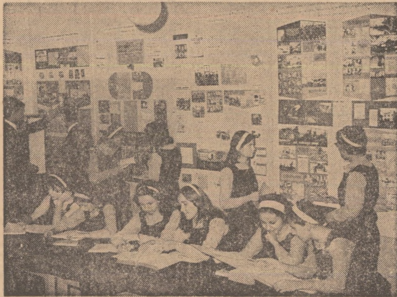
În cabinetul de științe sociale al Liceului „Mihail Sadoveanu“ din București.

Gînduri de mare frumusețe, care circumscriu cu precizie un crez: acela al iubirii profunde, fără margini pentru țară, al datoriei de a face totul pentru binele și fericirea ei, a poporului său. Gînduri care alături de faptele și actele sale îl așază pe Cuza în Panteonul marilor oameni politici ai neamului nostru.