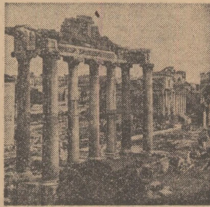
Roma: Forumul roman

Necesitățile dezvoltării învățământului dictate de factorii economici și sociali ai Italiei contemporane implică desigur o serie de cheltuieli care sînt suportate, într-un fel sau altul, de către stat, comunitățile locale, părinți. Sumele pe care le au de plătit aceștia din urmă pentru ca fiii lor să-și continue studiile încarcă, uneori destul de sensibil, bugetul familiilor, ceea ce se resimte nefavorabil asupra nivelului lor de trai, mai