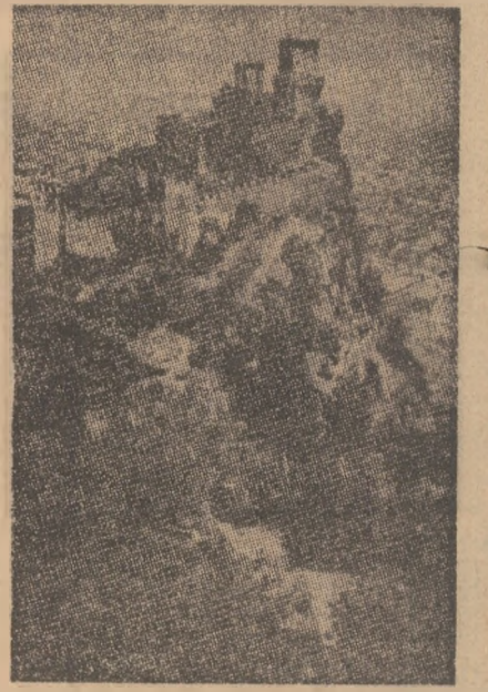
San Marino — Silueta muntelui Titan.