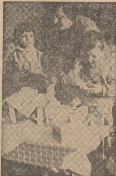
În camera păpuşilor — Grădiniţa din comuna Sintana, judeţul Arad