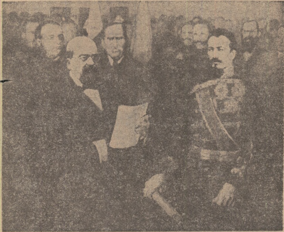
Alexandru Ioan Cuza și Mihail Kogălniceanu, întemeietorii Universității din Iași (Tablou din Muzeul Unirii din Iași)