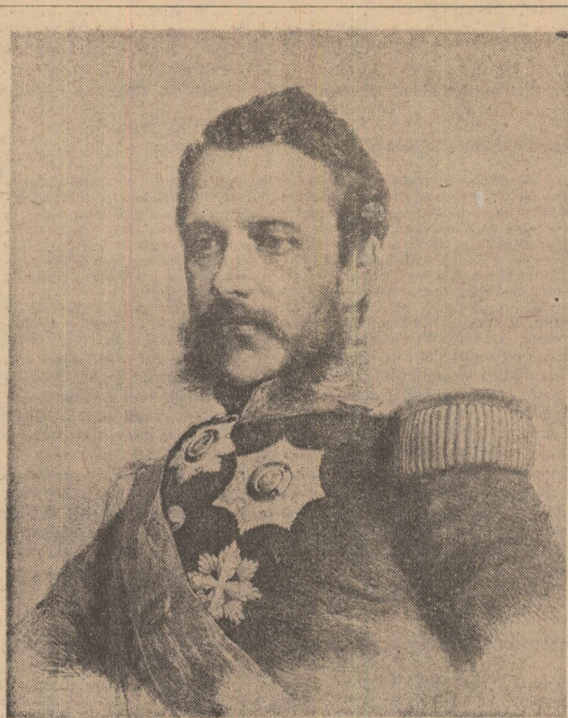
Alexandru Ioan Cuza

Guvernul însă parea decis a întrebuița cele dupe urmă espediente ca să facă să triumfe candidatul său de predilecțiune, Bibescu sau Știrbei. Ro-