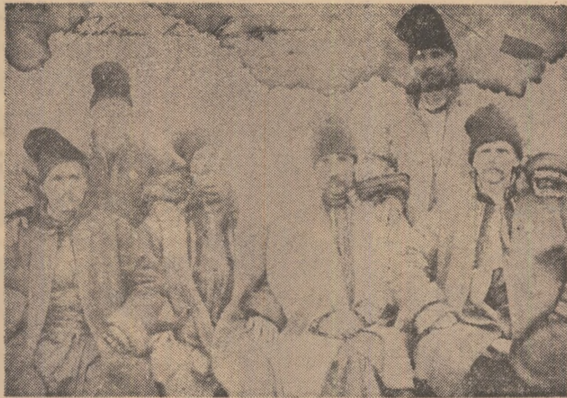
Tărani moldoveni și munteni din Divanul ad-hoc