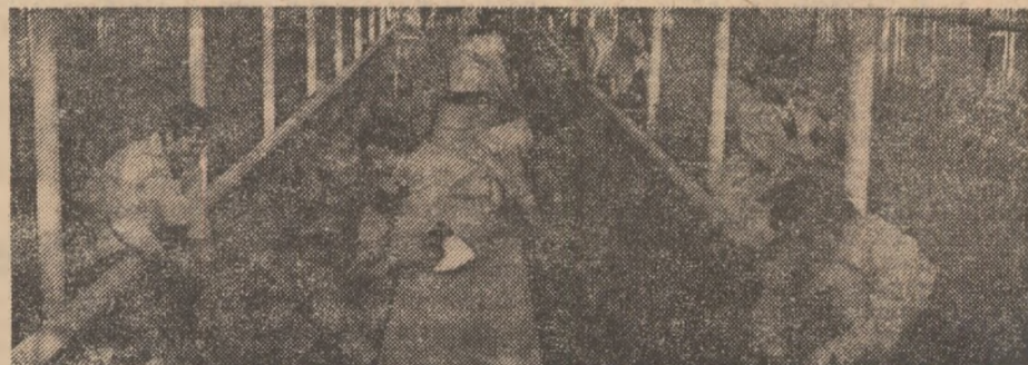
Activități practice la Stațiunea micilor naturaliști la Palatul pionierilor din Capitală

Plenara C.N.O.P. exprimă adevărată recunoștință Partidului Comunist Român, conducerii sale, secretarului general al partidului, tovarășului Nicolae Ceaușescu, tuturor comuniștilor, pentru tot ceea ce au făcut și fac ca tinerele vlăstare ale patriei să crească viguros, să se pregătească temeinic pentru muncă și viață. Asigurăm conducerea partidului, organele și organizațiile de partid că Organizația pionierilor va acționa pe mai departe cu răspundere și însuflețire pentru îndeplinirea exemplară a sarcinilor ce i-au fost încredințate, că va contribui activ, din toate puterile, la dezvoltarea și perfecționarea învățămîntului, la propășirea patriei.