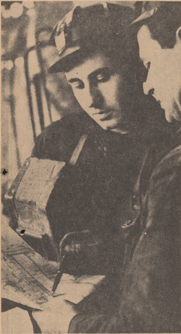
De la proiectul din schiță, la piesa reală

Nu ne-am propus să considerăm ca riguroase obiective procentele înscrise de elevi (ca o autoapreciere a nivelului atins în însușirea meseriilor), dar, ceea ce putem reține ca semnificativ este faptul că peste 80% din elevii și elevii celor 6 grupuri care au făcut autoapreciere procentuală consideră că și-au însușit în bună măsură meseriile respective (notându-le între 60%—90% grad de însușire a meseriei). Ponderea celor sub 50% și la nivelul a 50% meserie cunoscută și însușită este relativ restrânsă.