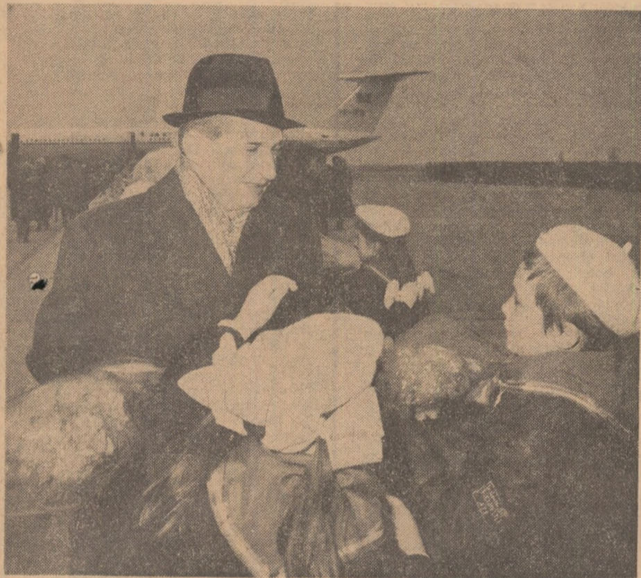
In momentul sosirii, pe aeroportul Otopeni

12 pagini și suplimentul „Științe sociale” — 1 leu