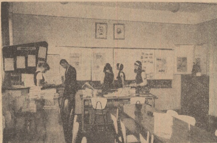
In cabinetul de științe sociale al Liceului nr. 3 din Baia Mare

Iată doar cîteva idei și păreri în legătură cu utilizarea faptului istoric în lecțiile de socialism științific. Cunoașterea experienței altor cadre didactice în această direcție ar fi binevenită și necesară, fiind interesați s-o utilizăm în munca noastră.