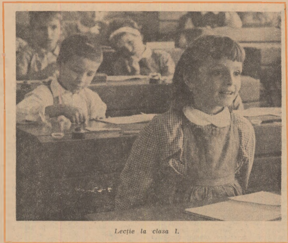
Lecție la clasa I.

Prin sondaje repetate la clase de diferite nivele de vîrstă, în ședințe de analiză la nivelul consiliului profesoral sau catedrelor, am constatat că o altă sursă a supraîncărcării este tendința unor cadre didactice de a realiza programa școlară la nivelul ei maximal cu toți elevii. Intenția este laudabilă, dar este clar că nu toți elevii au aceleași posibilități genetice, aceeași putere de cuprindere, de a munci cu cartea etc. În plus, insistîndu-se în clasă prea mult pe examinarea și antrenarea elevilor slabi, chiar coborînd nivelul discuțiilor unei clase la nivelul acestor elevi, școlarii buni și foarte buni bat pasul pe loc. Am căutat să înlăturăm acest neajuns, alcătuiind grupe cu elevii care întîmpină greutăți în însușirea materiei. Cu ei am realizat meditații și pregătiri speciale, folosind metode anume de lucru. Cu elevii buni și foarte buni, am organizat, de asemenea, pregătiri speciale — după opțiuni — în vederea participării lor la olimpiade, anumite examene și concursuri. Pe elevii din clasele terminale îi pregătim în cercuri speciale la care își dau concursul cadrele școlii sau cadre invitate de la universitățile și institutele din București și Brașov. Rezultatele pregătirii pe grupe diferen-