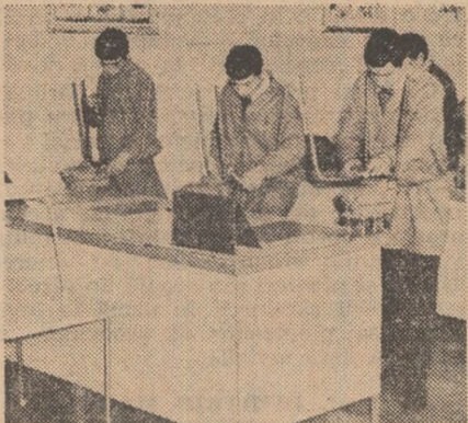
Lucrări practice în atelierul de lăcătușărie

La absolvirea cursurilor, tinerii se pot încadra în muncă mai ales la uzinele „Rulmentul”, „Hidromecanică”, „Steagul Roșu”, „Metrom”, „Unelte și scule” din Brașov.