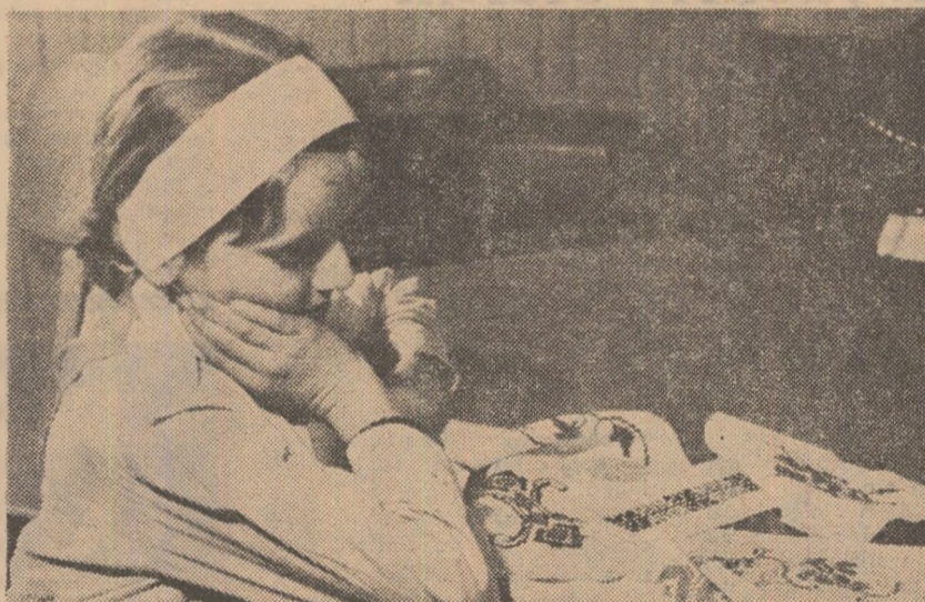
„Pe care să-l aleg?”

în minuirea unor procedee de lucru, de „proiectant” al unor acțiuni, de culegător al unor informații, de mînuitor al diferitelor unelte, de coechipier în diferite activități colective etc. Or, este un adevăr de netăgăduit, că asemenea roluri, cu relațiile interpersonale pe care le afectează, angajează mult mai pro-