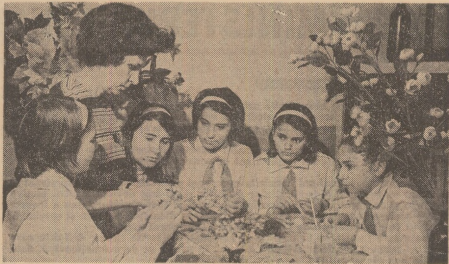
Pregătiri pentru 1 Mai