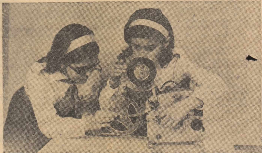
Aspect din activitatea pionierilor de la Cineclubul Casei pionierilor din Rimnicu-Sărat