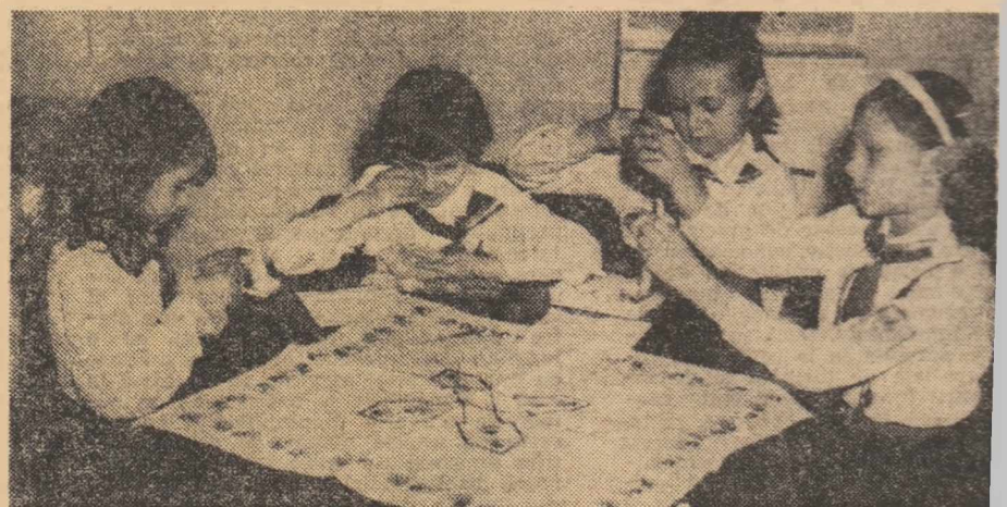
La școala artei populare

înființat de curînd. ● „Ajutorul dat elevilor din treapta I de liceu amenințată să rămînă corigenți” — o temă care se dezbate în toate grupele sindicale ale liceelor din Sectorul 7 — București. În același sector sînt organizate și două schimburi de experiență. Primul: între învățătorii de la Școala generală nr. 169 și Grădinița de copii nr. 94, avînd drept obiectiv integrarea actualilor preșcolari în clasa I a viitorului an școlar. Al doilea (la nivelul catedrelor din școli) se intitulază: „Activizarea gîndirii elevilor la lecțiile recapitulative”. ● Comisia sindicatelor din învățămînt și Casa corpului didactic din municipiul București pregătesc o amplă expoziție de material didactic, creație a oamenilor de la catedră. Expoziția, dotată cu premii, se va deschide în cinstea Zilei învățătorului.