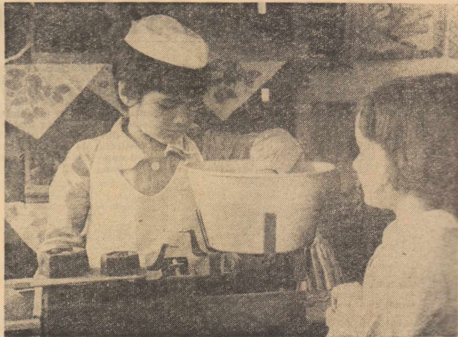
„De-a vînzătorul și cumpărătorul”

Una din orientările principale ale strategiei elaborării conținutului învățămîntului contemporan și anume diversificarea acestuia, prin conceperea unor grupe de discipline comune și a altora opționale, se reflectă — în mod adecvat — și în elaborarea conținutului educației preșcolare. În acest sens, merită să fie subliniat faptul că multiplele activități menționate în programă sînt prevăzute în planul de învățămînt fie ca activități comune (obligatorii) cu întreaga grupă de copii, fie ca activități alese de copii sau de educatoare. Numărul celor dintîi crește de la o grupă la alta, în raport cu particularitățile dezvoltării psihofizice ale copiilor (de la 11 în grupa mică, la 13 în grupa mijlocie și la 16 în grupa mare). Celelalte, avînd un caracter complementar, întregesc programul activităților zilnice, îndeplinind — prin similitudine cu planul de învățămînt școlar — rolul disciplinelor la alegere — obligatorii; ele sînt menite să răspundă adecvat dorințelor copiilor, intereselor, care încep să se manifeste,