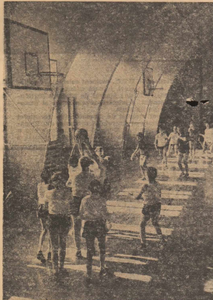
În sala de sport a Liceului nr. 35 din București