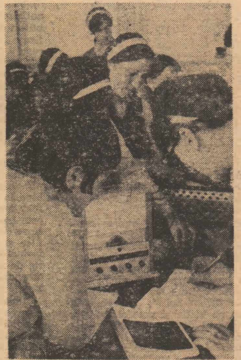
Lucrări practice în laborator

3. Pregătirea, perfecționarea, îndrumarea și controlul cadrelor didactice în domeniul evaluării progresului școlar; abordarea istorică și comparativă a sistemelor de evaluare, evaluarea ca operație inversă a activității didactice, lucrul cu subiect pe unitate școlară sau pe zone teritoriale; studiul documentelor de examinare și de evidență a notării în acțiunea de îndrumare și control a cadrelor didactice, notarea în carnetul elevului ca modalitate de sporire a interesului și răspunderii acestuia și ale părinților față de rezultatele școlare; direcții noi și experimente în evaluare, examinare și notare.