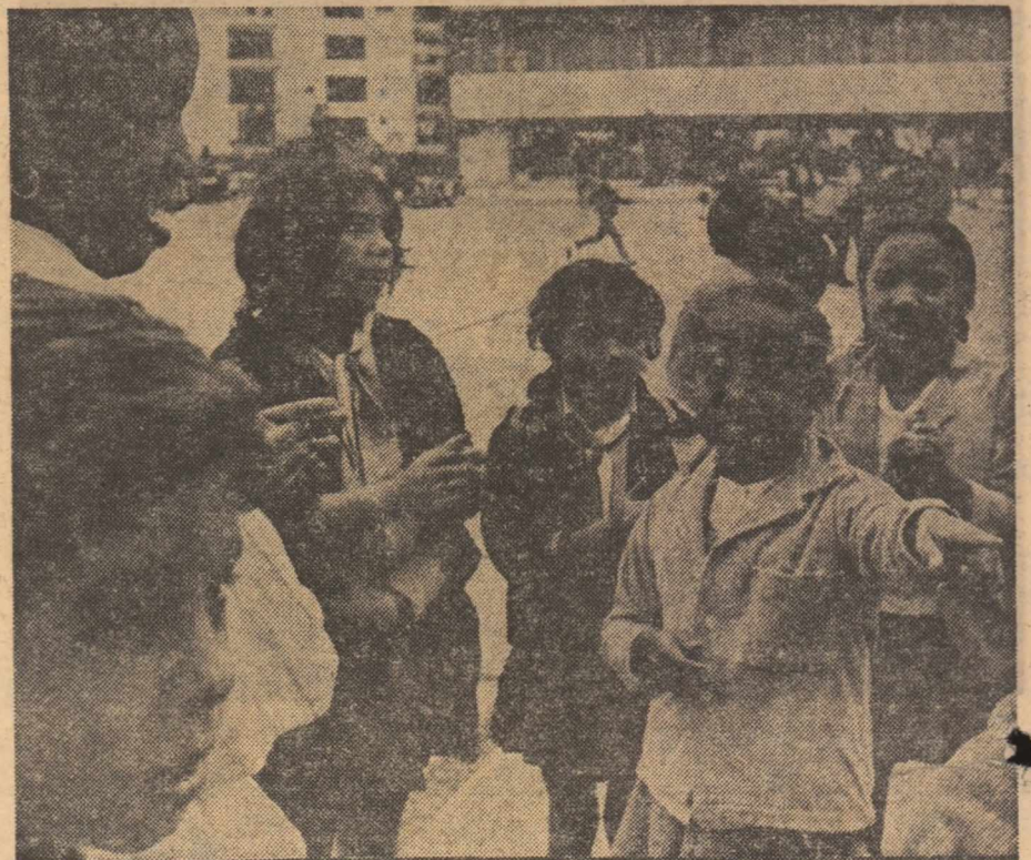
Recreație a elevilor modernei școli primare „Salvador Allende” din cartierul Alamar din Havana.