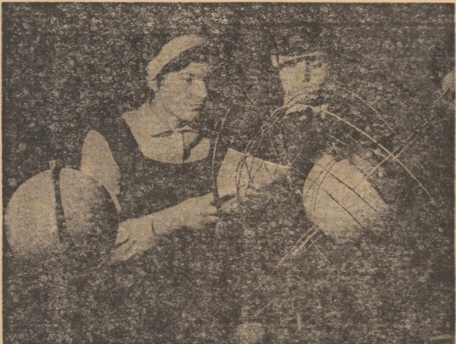
Lecție de astronomie la Liceul nr. 1 din Bistrița