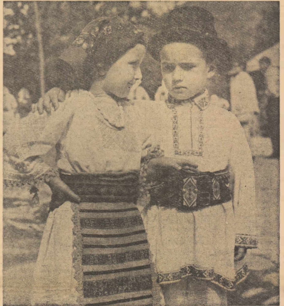
Copii din comuna Maieru (județul Bistrița-Năsăud) la poarta școlii, în tradiționalul port de pe plaiurile lui George Coșbuc și ale lui Liviu Rebreanu