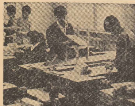
În atelierul de tâmplărie al Școlii generale din Orșova

Ținînd seama de faptul că activitățile productive ale elevilor de la acest nivel de învățămînt se desfășoară numai pe baza unei planificări calendaristice de aplicare a programelor școlare, fără plan de producție, precum și de necesitatea urmării și folosirii eficiente a veniturilor realizate pentru nevoile de autodotare și pentru procurarea materialelor, este necesar să se cunoască, trimestrial, realizările în această direcție, pe baza unei dări de seamă. Întrucît școlile generale nu au o evidență contabilă proprie, se impune ca dările de seamă privind realizările obținute cu elevii în activitatea tehnico-practică să fie întocmite pe baza planurilor de venituri și cheltuieli pentru autofinanțare, întocmite de instituțiile care finanțează școala respectivă. În aceste dări de seamă se consemnează, pe baza evidenței contabile existente la instituția care finanțează școala, veniturile propuse — cele realizate și soldul (disponibilitățile financiare existente la sfîrșitul trimestrului) din valorificarea produselor obținute în atelierele-școală, pe loturile școlare, din creșterea animalelor,