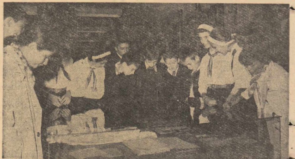
Pionieri și școlari în vizită la Muzeul de istorie a partidului comunist, a mișcării revoluționare și democratice din România.