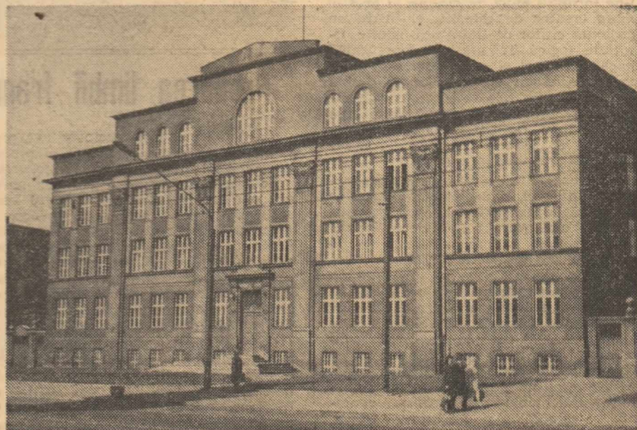
Liceul „Adam Mickiewicz” din Poznan, R. P. Polonă