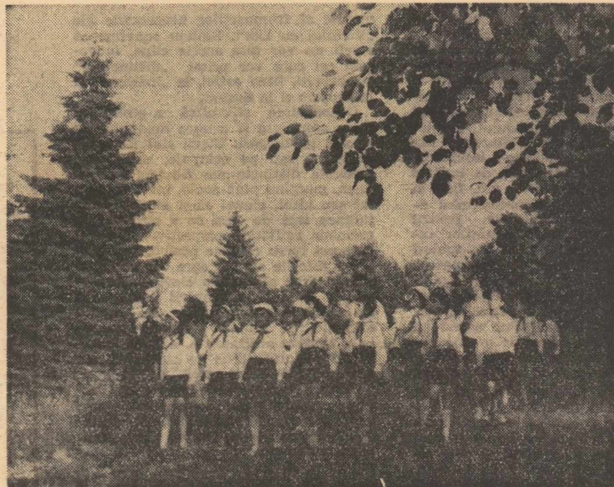
Odată cu începerea vacanței, pionierii participă la numeroase excursii

Conducerile școlilor vor asigura păstrarea, în permanență, la biblioteca școlii, a unui set de programe valabile în anul școlar curent, ca document pedagogic și act de stat.