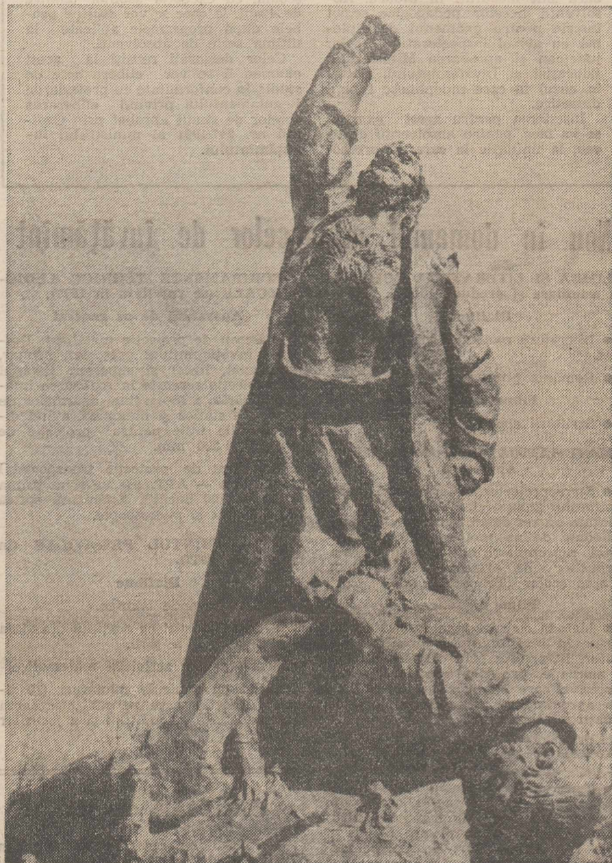
La Alexandria, un omagiu adus țăranilor căzuți în Răscoala din 1907