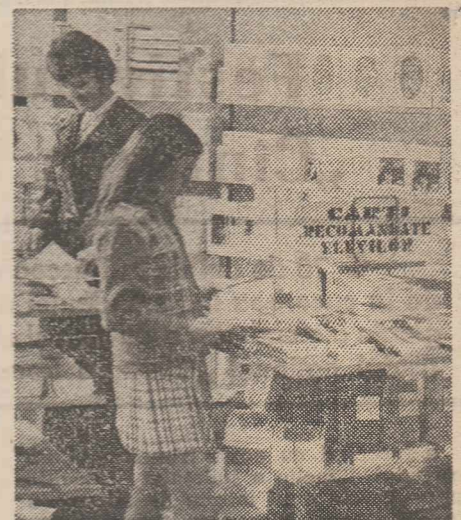
Urmărind cărțile nou apărute

A apărut „Admiterea în învățămîntul superior, 1977”