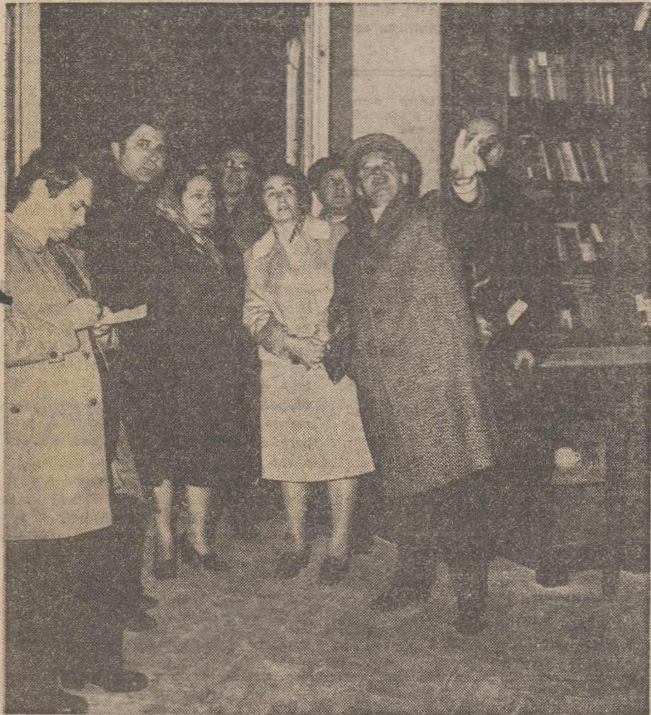
Și la Facultatea de medicină, grav avariată, ca peste tot în Capitală și în alte localități afectate de cutremur, secretarul general al partidului dă indicații prețioase pentru ștergerea urmelor calamității, pentru normalizarea vieții.