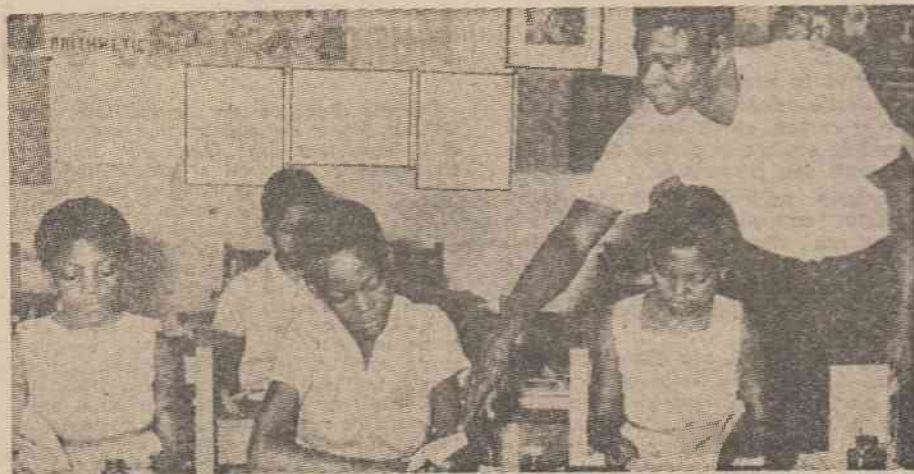
Ghana : Se înfăptuiește dreptul copiilor la lumina științei de carte

Nu avem desigur în vedere „ameliorările“ de genul celor din unele sisteme școlare capitaliste exprimate prin creșterea indulgenței față de libertinajul școlărilor. Dincolo de acestea sînt de semnalat și foarte multe orientări valoroase ale gândirii și practicii pedagogice de peste hotare. Astfel pedagogii polonezi, în urma studiului „comitetului experților“ asupra stării învățămîntului, au procedat la „lărgirea“ rubricii din catalog care adăpostea nota la purtare — prin adoptarea unui sistem mai descriptiv al comportamentului elevului. Între altele, se menționează faptul că în certificatele școlare, sînt nominalizate funcțiile sociale îndeplinite de elev în cadrul diverselor organizații, distincțiile și premiile obținute în cursul anului școlar, locul pe care s-a situat la olimpiade, pe discipline de învățămînt, la campionatele sportive, realizările în cadrul activităților din cercurile tehnice și alte asemenea „amănunte“ care concură la întregirea imaginii privind comportamentul și profilul moral al elevului, asupra pregătirii lui reale pentru viața în societate.