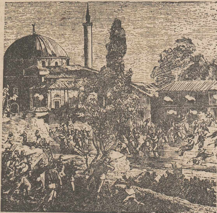
Lupta de la Giamia Cadiului din Plevna (20 Iulie).