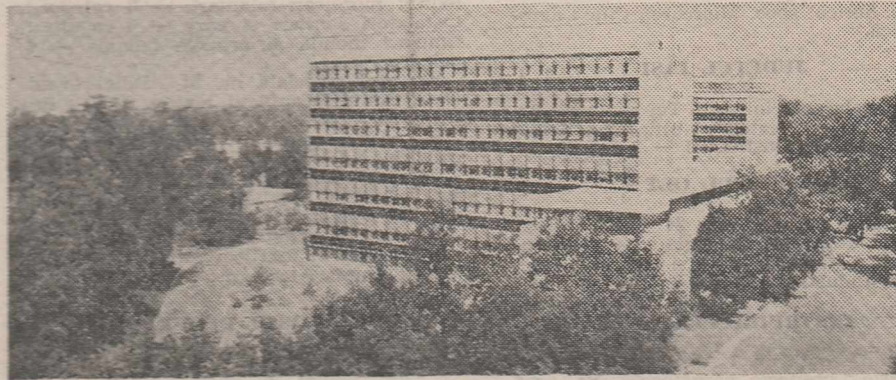
Noua clădire a Universității „Lajos Kossuth” din Debrecin (R.P. Ungară)