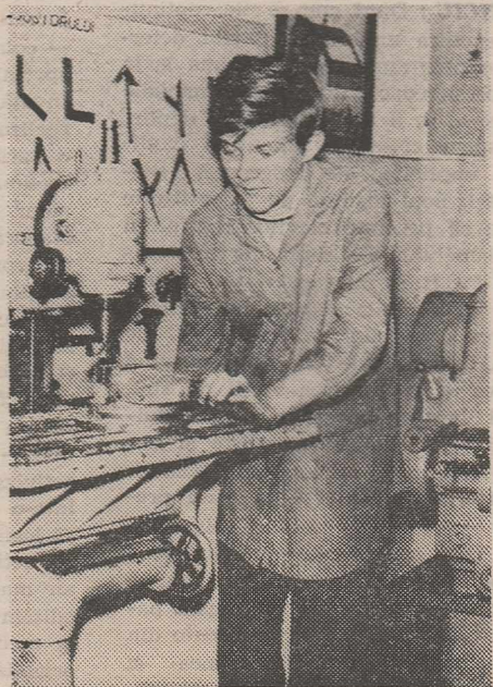
Practică în atelier