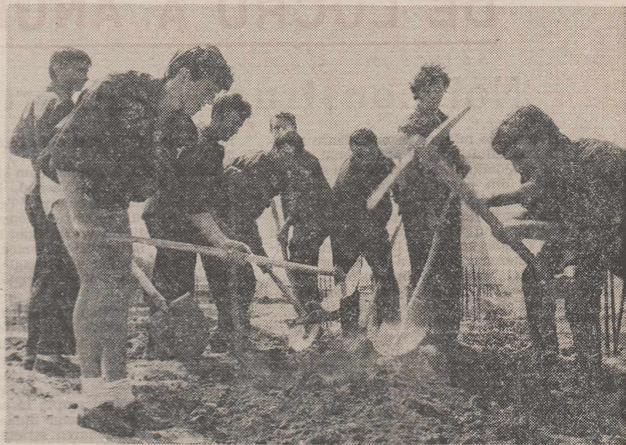
Elevi la muncă patriotică pe șantierele de construcții din București