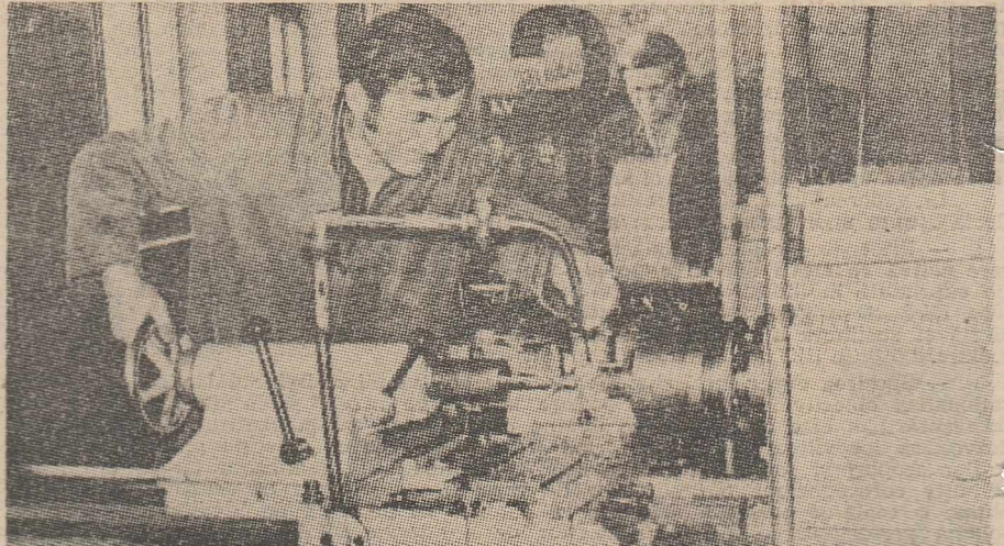
Activități practice la Centrul școlar profesional din localitatea Trstenik, din R. S. F. Iugoslavia.