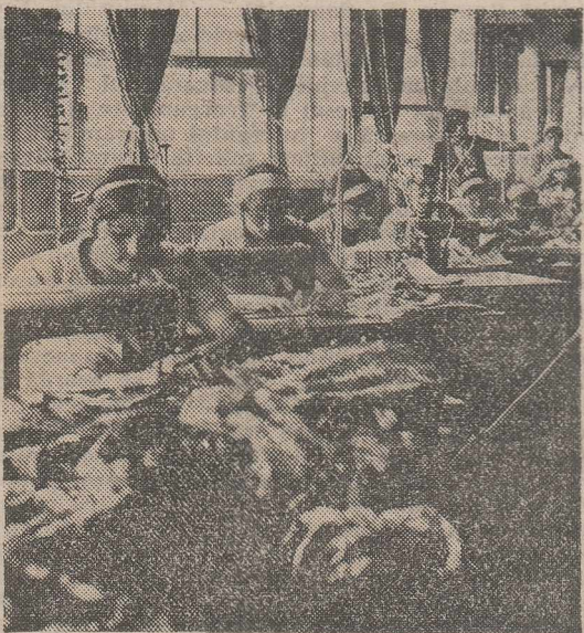
Absolvente ale școlilor din Scornicești în fabrică