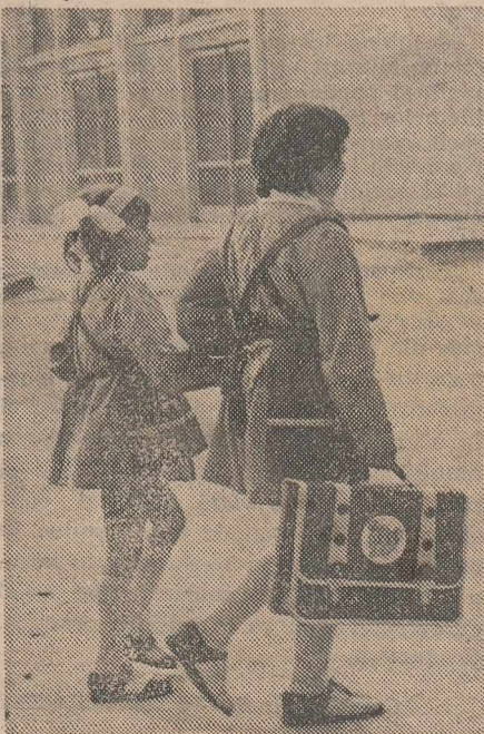
Din nou la școală