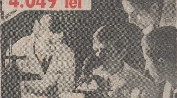
Pentru un elev al liceului