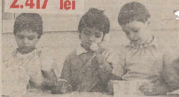
Pentru un copil preșcolar