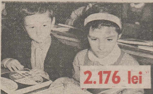
Pentru un elev din învățămîntul primar și gimnazial