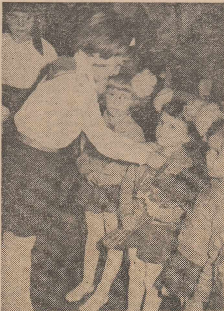
Primirea în organizația „Șoimii patriei”. Aspect emoționant la Grădinița nr. 9 din Moinești-Bacău