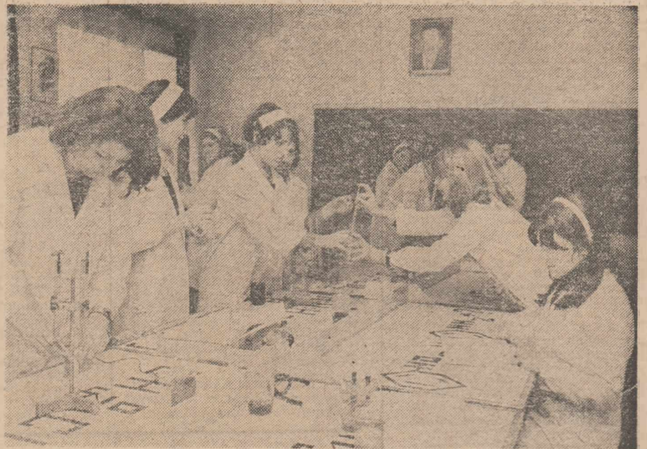
Lección de chimie organică în laboratorul Liceului industrial nr. 1 din Capitală

Luînd cunoștință, cu satisfacție, de rezultatele alegerilor — nou imbold la muncă și faptă pentru a urzi destinele mărețe ale României socialiste — pretutindeni — în fabrici, pe șantiere, pe ogoare, în institutele de cercetări, în școli — muncitorii, țărani, intelectuali, toți oamenii muncii, fără deosebire de naționalitate își sporesc eforturile constructive, în voința care ne leagă pe toți, de a face din patria noastră o țară a belșugului, a fertilității materiale și spirituale, spre binele minunatului nostru popor.