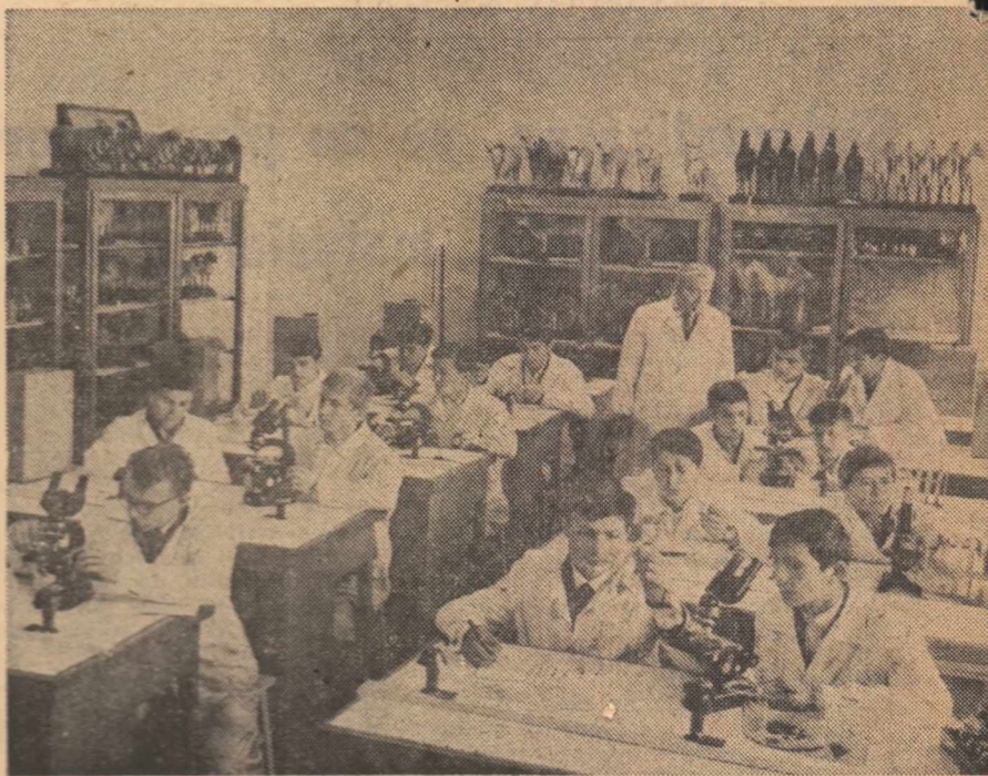
În laboratorul de microbiologie al Liceului agroindustrial din Turda

am recurs la metoda conversației asociată cu lucrul în grup. Clasa a fost împărțită în patru grupe, fiecare avînd de pregătit cite o legendă din literatura universală și poemul „Dan, căpitan de plai“.