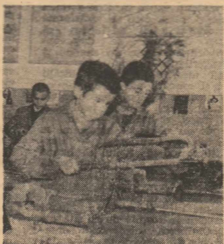
În atelierul de lăcătușărie al Școlii nr. 23 din Capitală

Ca dirijantul mi-am sport convingerea că pentru a-i înțelege pe tineri trebuie să rămân mereu tânăr: sufletele, că principala noastră vocation trebuie să ră-