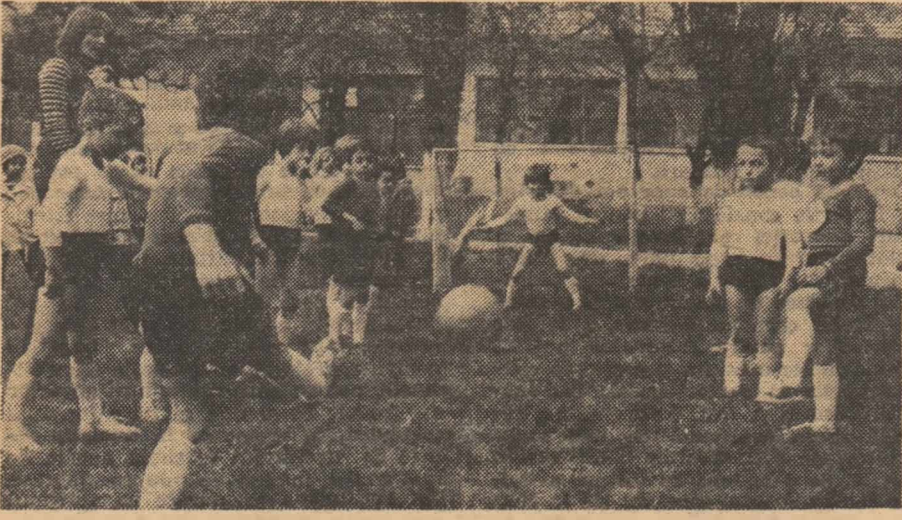
Sport în aer liber, la Grădinița Fabricii de confecții și tricotate din București