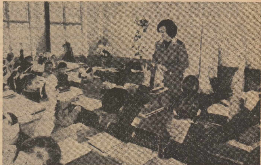
Instantaneu la o oră de limba română la clasa a IV-a la Liceul „George Coșbuc” din Nădlac, județul Arad

Inv. MARIA AGAFIȚA Școala din Siliștea, comuna Dolhasca, județul Suceava