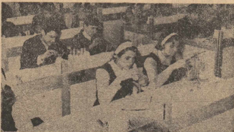
Activitate atentă și aprofundată, în laboratorul de chimie, pentru a pătrunde tainele materialității lumii