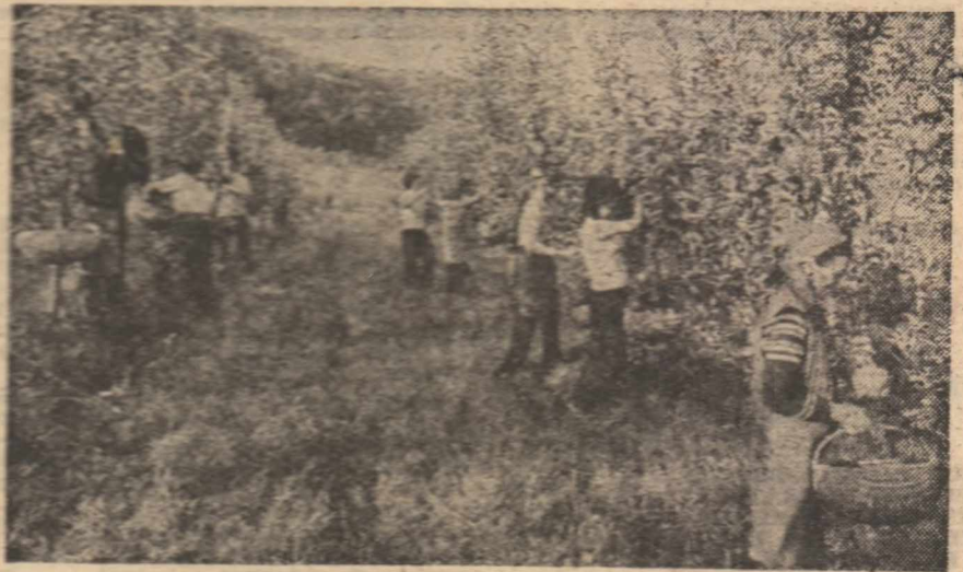
Elevi la practica agricolă

1. Importanța teoretică și practică a expunerilor tovarășului Nicolae Ceaușescu