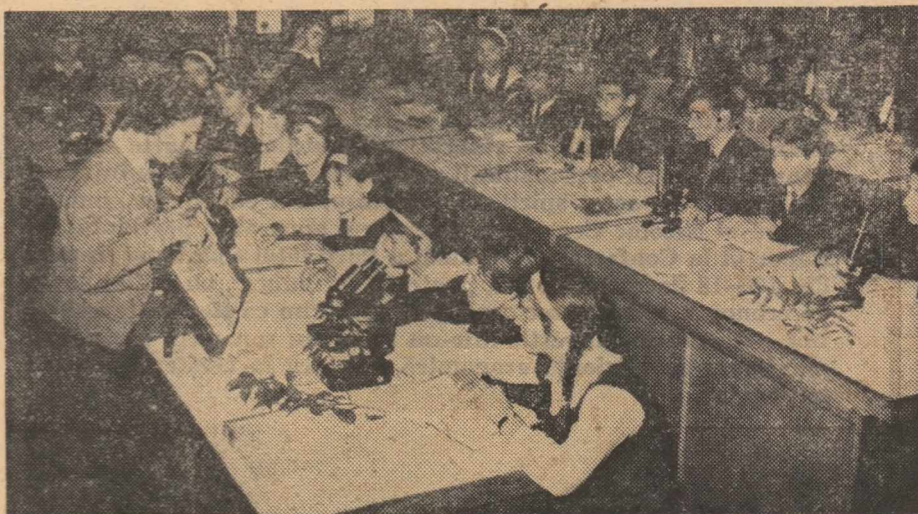
O lecție în laborator — un amplu teren de relații pentru cunoștințele interdisciplinare