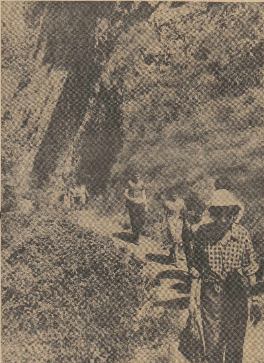
Străbătind plaiurile neasemuit de frumoaselor meleaguri românești