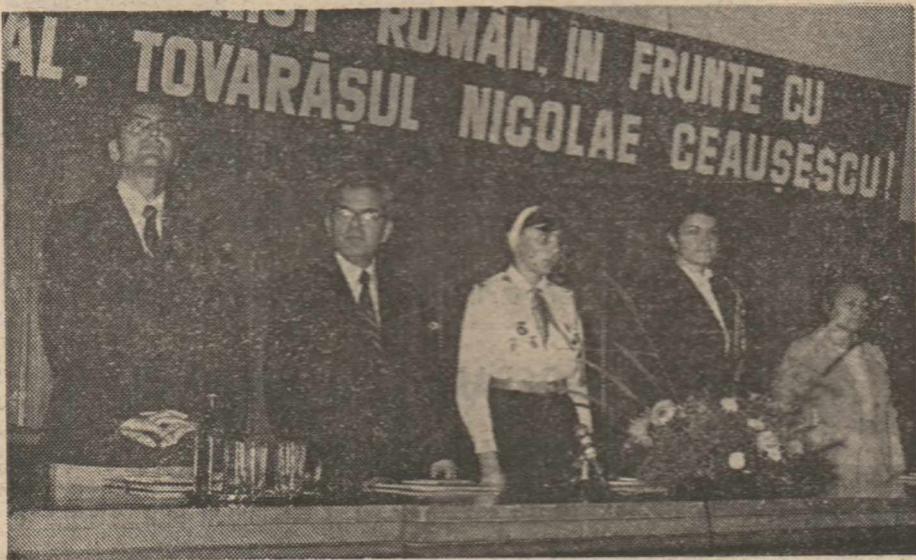
În cadrul unei emoționante întâlniri cu pionierii participanți la cel de-al XI-lea Forum Național.

ținută în acest cadru fertil, modul în care comisiile și comandamentele pionieresti au acționat pentru infaptuirea orientărilor și indicațiilor secretarului general al partidului, căile și mijloacele de intensificare a întregii activități în vederea creșterii răspunderii tuturor pionierilor și școlărilor față de învățatură, pentru educarea patriotică, revoluționară, prin muncă și pentru muncă a acestora, îmbunătățirea conținutului politico-educativ al manifestărilor pionieresti din Festivalul Național „Cintarea României”, organizarea instructiv-educativă a timpului liber, cuprinderea copiilor la competițiile sportive din cadrul „Daciader”. Au avut loc întâlniri cu membri ai secretariatului Comitetului județean de partid Iași, ai secretariatului C.C. al U.T.C., cu prof. univ. dr. doc. Ion Teoreanu, ministrul educației și învățămîntului, cu alți activiști de partid și de stat, cu oameni de știință, artă și cultură; s-au organizat schimburi de experiență cu unități școlare din municipiul și din județul Iași, vizite în întreprinderi industriale și unități agricole, spectacole, evocări, parade pionieresti. În cadrul Fo-