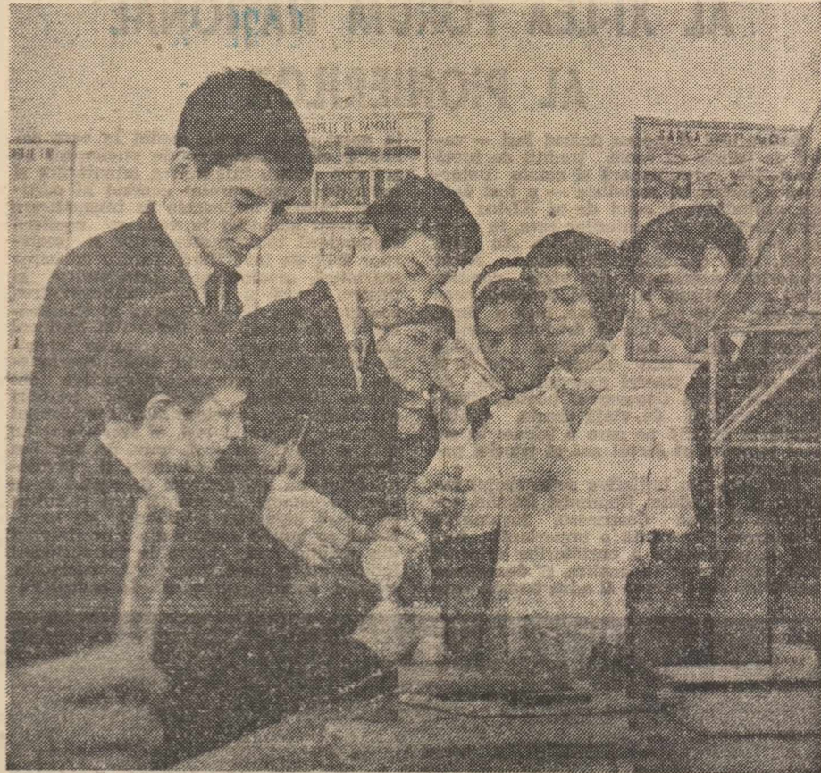
În laboratorul de biologie al Liceului Agroindustrial „Ion Ionescu de la Brad” din Roman, viitorii specialiști ai ogoarelor descifrează, în eprubete, tainele marilor recolte.

Învățământul în școlile cu predare în limbile naționalităților conlocuitoare