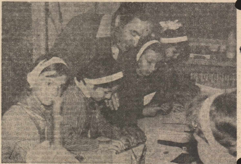
Știi cum se construiește un aeromodel? Mai întâi, se trasează o linie pe foaia de calc! (Școala nr. 6 din Sibiu).

4. Consolidarea rețelei școlilor de 10 ani, cu deosebire în mediul rural, profilarea claselor a IX-a și a X-a din aceste