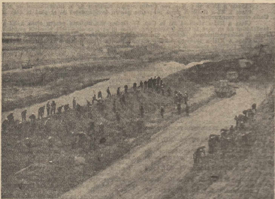
Pe vittoarea magistrală albastră a Canalului Dunăre-Marea Neagră, tinereșea elevilor și studenților s-a ridicat. și în această vară, la cota înalte.

cate condițiile noi, superioare, create activității de instruire practică a elevilor în condițiile preluării atelierelor școlii de către întreprinderi, subliniindu-se răspunderile ce revin unităților de învățământ în realizarea unei bune conlucrări cu întreprinderile în pregătirea practică a elevilor și participarea acestora la munca productivă;