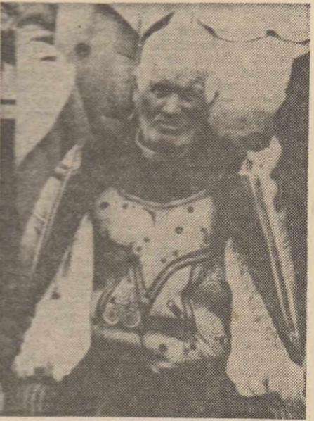
Port străvechi de pe platourile teleormănene