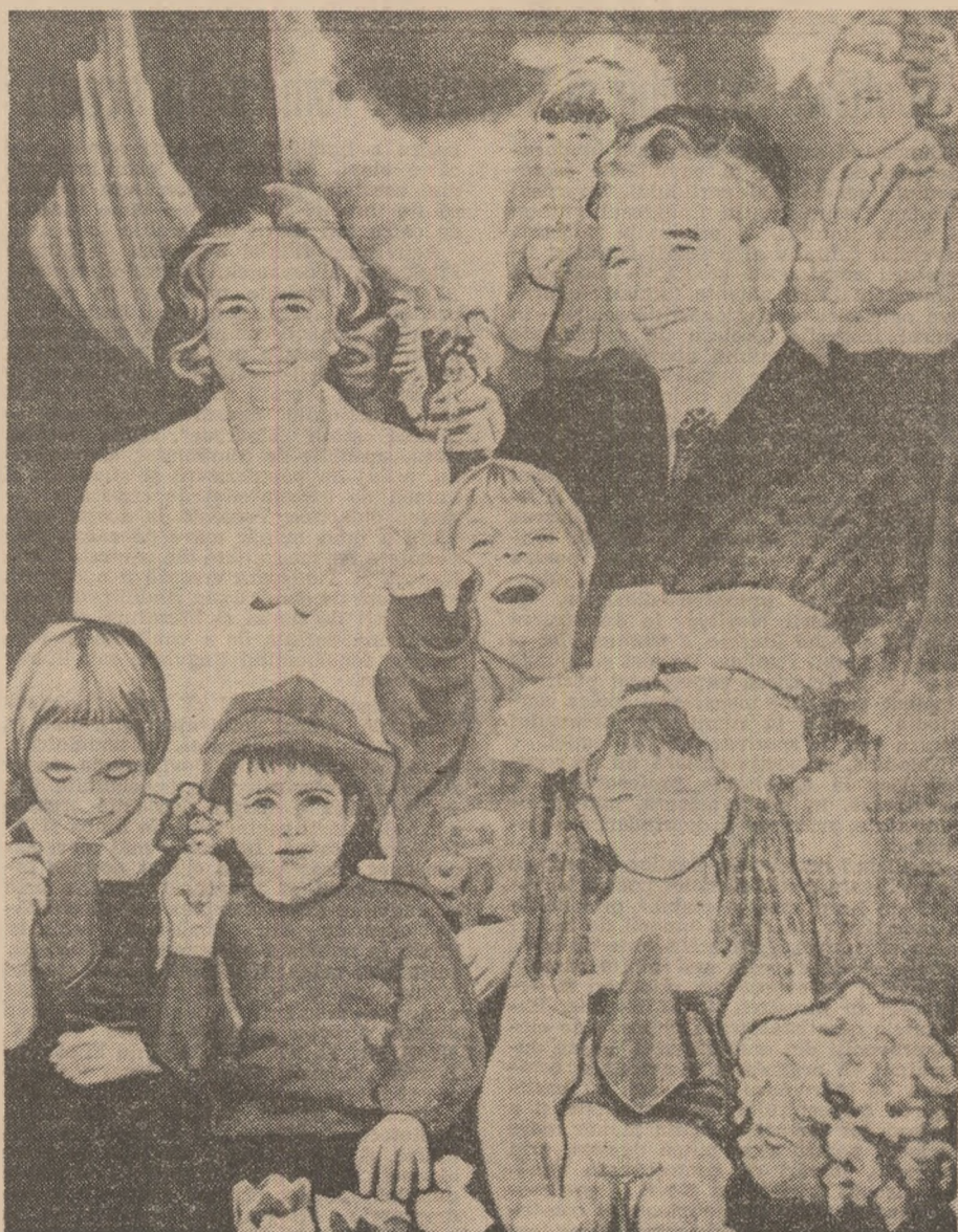
OMAGIU — de Cornelia Ionescu