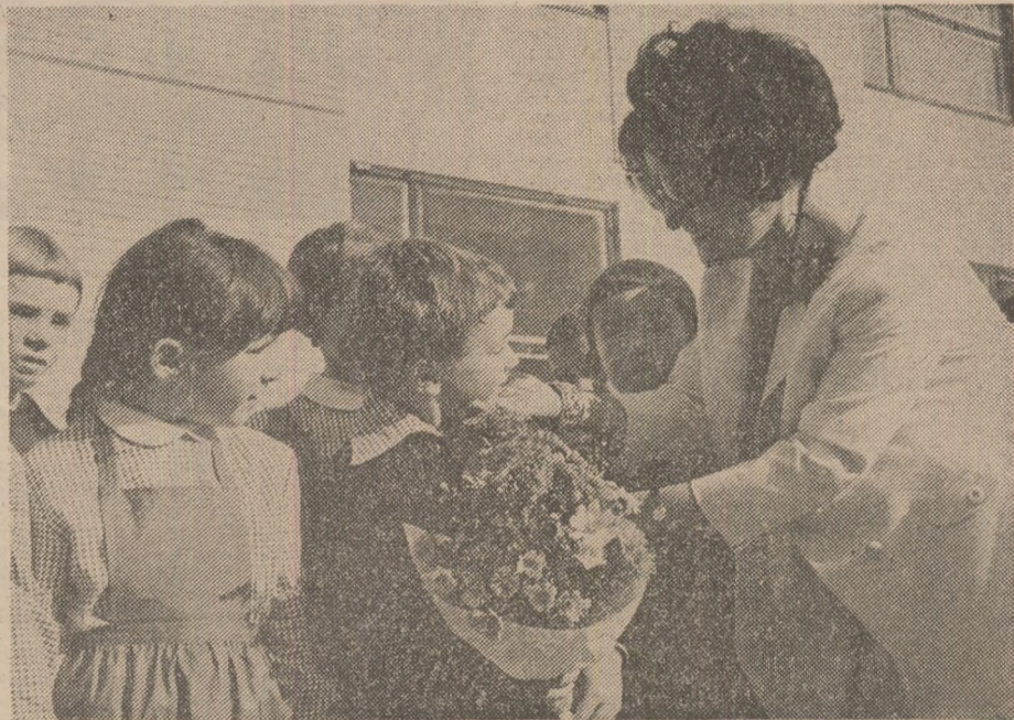
O imagine simbol: tradiționalul buchet de flori pe care elevii îl oferă, de „Ziua Învățătorului”, educatorilor lor.

„După Eminescu este foarte greu să devii poet!” iată o sintagmă care mă obsedează de ani de zile. Ca și întrebările: Ce-ar fi fost limba română, ce-ar fi fost literatura română, ce-ar fi fost spiritualitatea noastră fără inestimabila contribuție a lui Mihai Eminescu? Evident, limba română își va fi păstrat plasticitatea și culoarea de astăzi, dar, pe undeva, fără contribuția lui Eminescu ar fi fost mai săracă, literatura română ar fi avut pe cerul universalității aceiași nemuritori aștri cu nimic mai prejos în luminozitate decît mulți dintre laureații Premiului Nobel, dar i-ar fi lipsit Lucașfărul de seară și de dimineață (în fond aceluși astru al frumuseții), iar spiritalia-