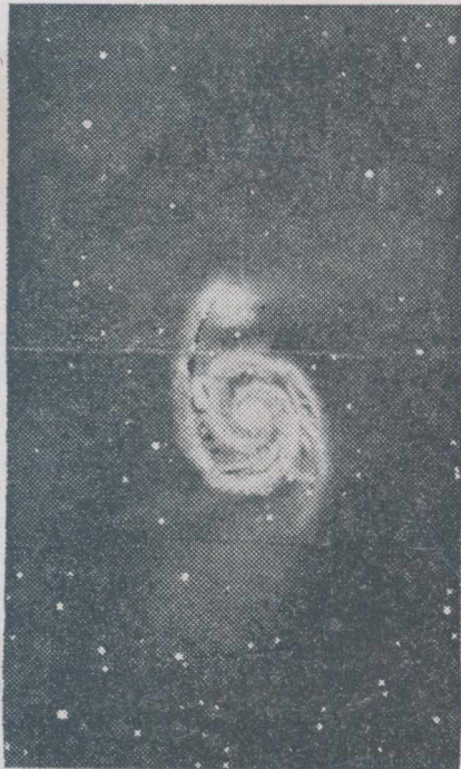
Nebuloasă în spirală M. 51 din Căminii de vânătoare.

închinau ca unei zeițe. Astronomii Heladei au ghicit că cele două stele strălucitoare ce apar una dimineața, cealaltă seara în așa fel în cât nu se văd niciodată amândouă, nu sunt decât cele două înfățișări sub cari se arată planeta plină de mister: luceafărul de dimineață și luceafărul de seară nu sunt decât una și aceeași stea. Flammarion, cel ce a cântat atât de mult frumoasa planetă, a numit-o „Venus, steaua dimineții” și „Venus, steaua serii”. Bătrânul astronom a murit cu dorința neîmplinită: el vrea ca să-i studieze cât mai aprofundat curiosul fenomen, una din multiplele frumuseți ale acestei planete: reflexul strălucirii ei pe apele liniștite ale mării. Atunci când întârzie mult după Soare, lumina ei devine atât de puternică în cât, pe lângă umbra ce o face lucrurilor de pe pământ, razele ei sunt reflectate de apa lină a mării sau a lacurilor, sunt ondulate în mii de reflexe ce-ți dau impresia unei feerii.