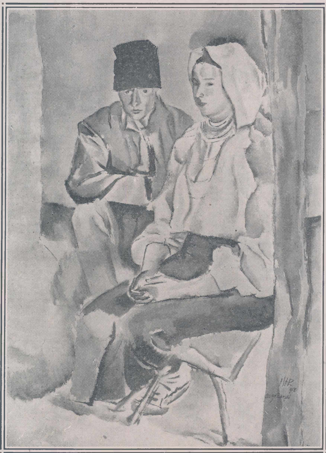
ȚARANI, desen de ISER