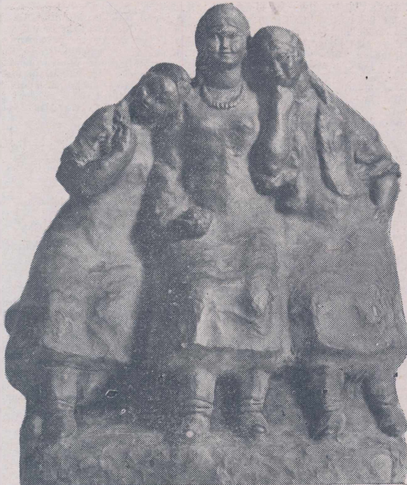
SEROVA MEDREA: GRUP DE ȚĂRANCE

A doua zi fu găsit spânzurat în fața sa, în fața lui pe o masă zăcea Biblia veche, deschisă la pagina în care se vorbește despre venirea Anticristului.