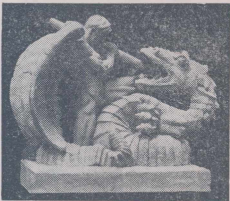
BARASKI: SF. GHEORGHE

Nu mai puțin cunoscutul critic dela Saturday Review (2 Ian.) L. P. Hartley o găsește „de o extremă simplitate și un considerabil patos“. „Cartea te lasă cu