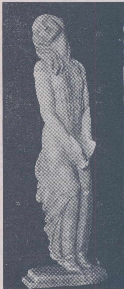
BARASKI: ANTINEA Salonul Oficial Premiul