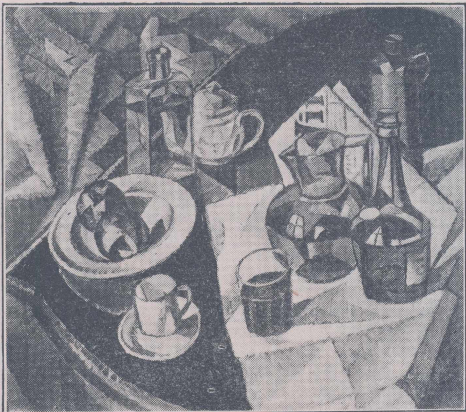
C. MIHAILESCU: NATURA MOARTA