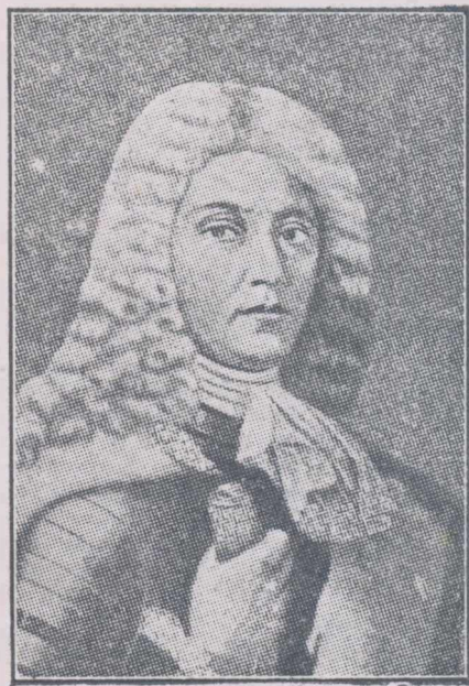
D. Cantemir 1673—1723

— „Aș putea să dau Turcilor toată țara până la Crusca, fiindcă am speranță de a o recuceri, dar cu nici un chip nu-mi pot călca cuvântul și extrăda pe un principe, carele pentru mine și-a răscăpătat onoarea odată perdută”. (Istoria imperiului otoman, Ediția Academiei Rom. tom. II p. 793).