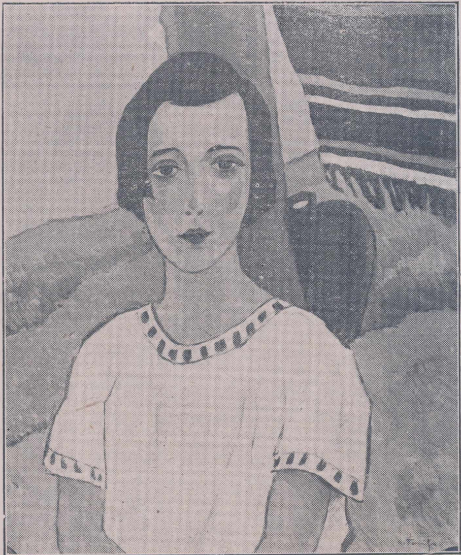
N. N. TONITZA EMIGRANTA NOSTALGICĂ

„Nu, nu blondu” a putut înțelege bine; căci el a fost prea încet să șoptească. Mironescu ridică din așternut, își încleștează geamurile cu palmele, clatină din cap și zâmbește ușurat, coaja depe gânduri!