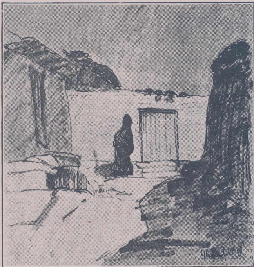
D. GHIATĂ: DESEN

Vorbele lui Dolinescu îi sună limpede 'n urechi; nu le prea poate însă prinde tălcul și temeul. Crede și el, că-i frumos și mai ales drept, ca atunci când unu' dintre soți calcă strâmb, celălalt, de simte nevoia, are tot dreptul, și ar trebui să aibă și voia să calce la fel, „Eu unul nu