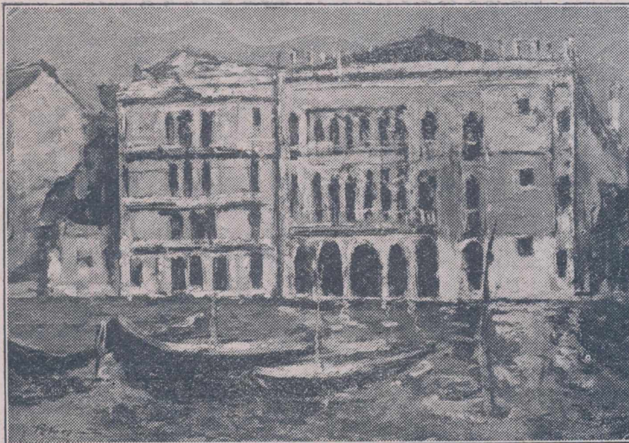
G. PETRAȘCU: PALAZZO CA D'ORO, VENEȚIA

...rii în fața lor, cercând să-mi re-ătez definițiile și sugestiile cari la Paris obiectul desfășurător i între mine și Bello și, nețicăr seama de prezența casierii i mâna pe scoici, le cântăreai, le examinai riguros, apoi mă de „Adam“, îl măsurai de sus,