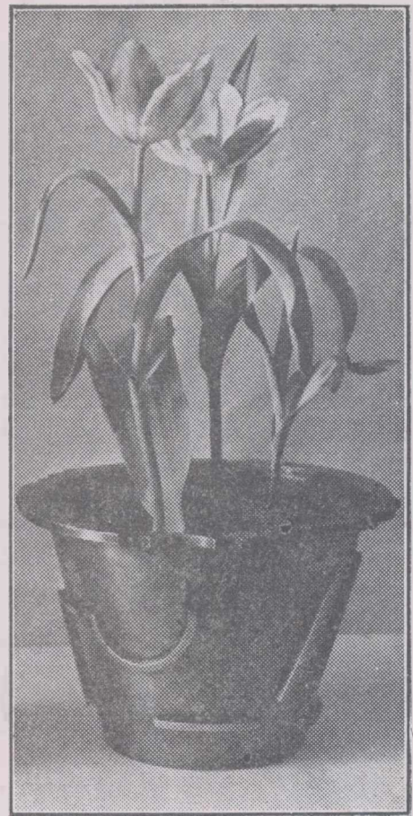
A. VESPREMIE: GHIVECI DE METAL Expoziția Academiei artelor decorative

La început Druse avu simțământul straniu pe jumătate precis, că adormise la sfârșitul războiului și că privea la un