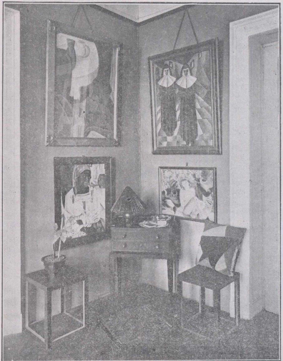
Din „EXPOZIȚIA ACADEMIEI ARTELOR DECORATIVE”