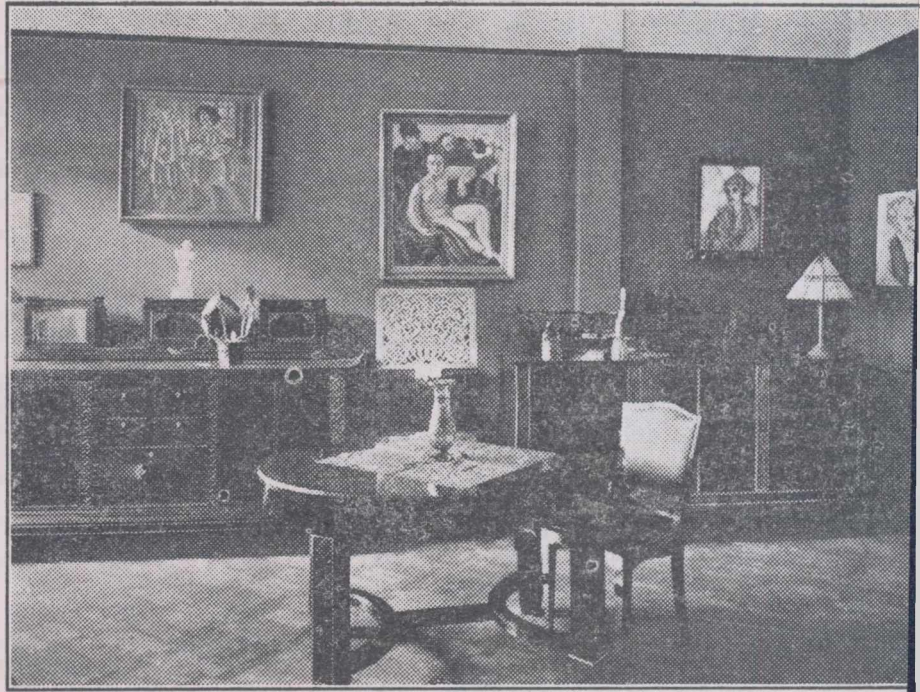
Din „EXPOZIȚIA ACADEMIEI ARTELOR DECORATIVE“

— Cum? E posibilă o astfel de închipuire? S'ar putea oare profana un vestmânt care lasă în urma lui atmosfera sfântă a altarului și care totuși te îmbie la o dragoste atroce, având ceva din poezia unei spovedanii? Și cu toate acestea săvârșești sacrilegiul pentru că este divină numai voalul acela sublim care închide chipul de ceară al surorii, ca într'o