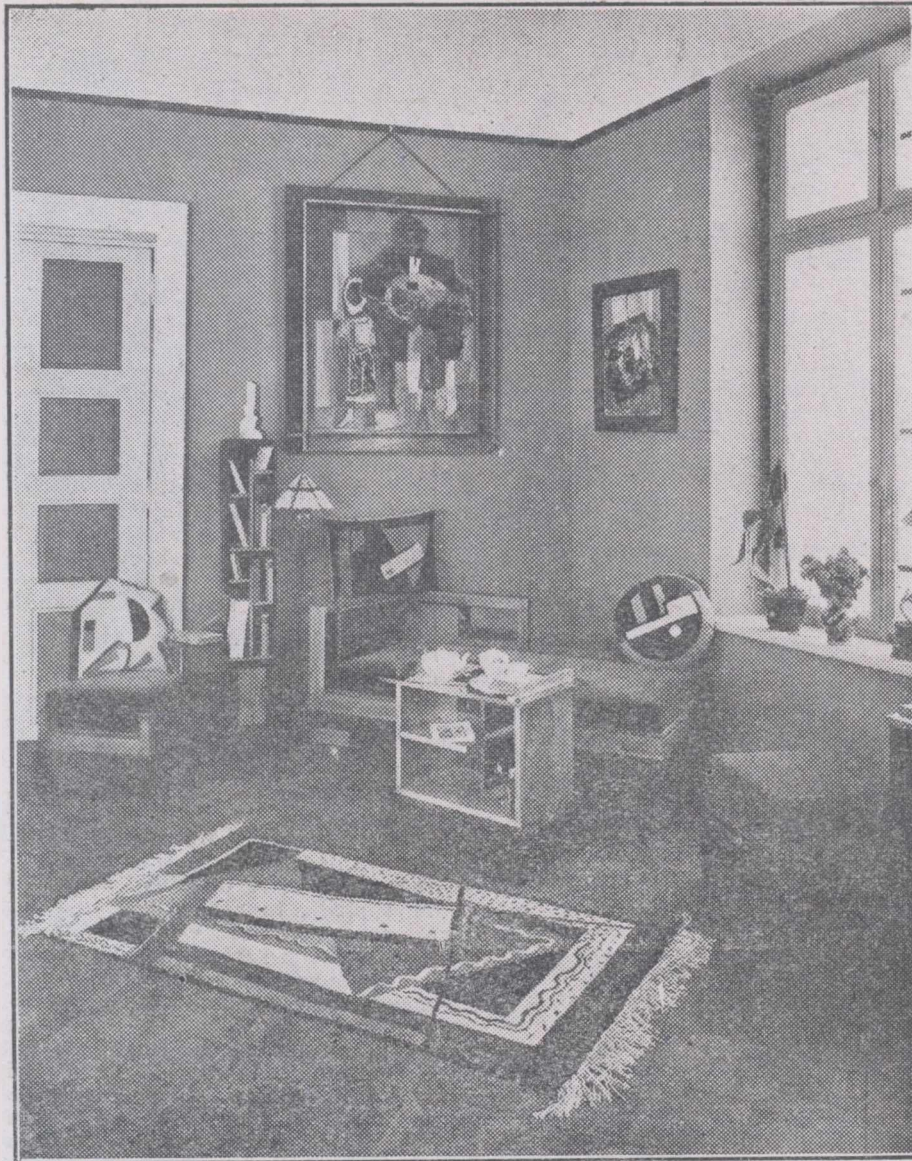
Din „EXPOZIȚIA ACADEMIEI ARTELOR DECORATIVE”

mal care grățește, se bucură doar de o modalitate articulată a unui fenomen universal.