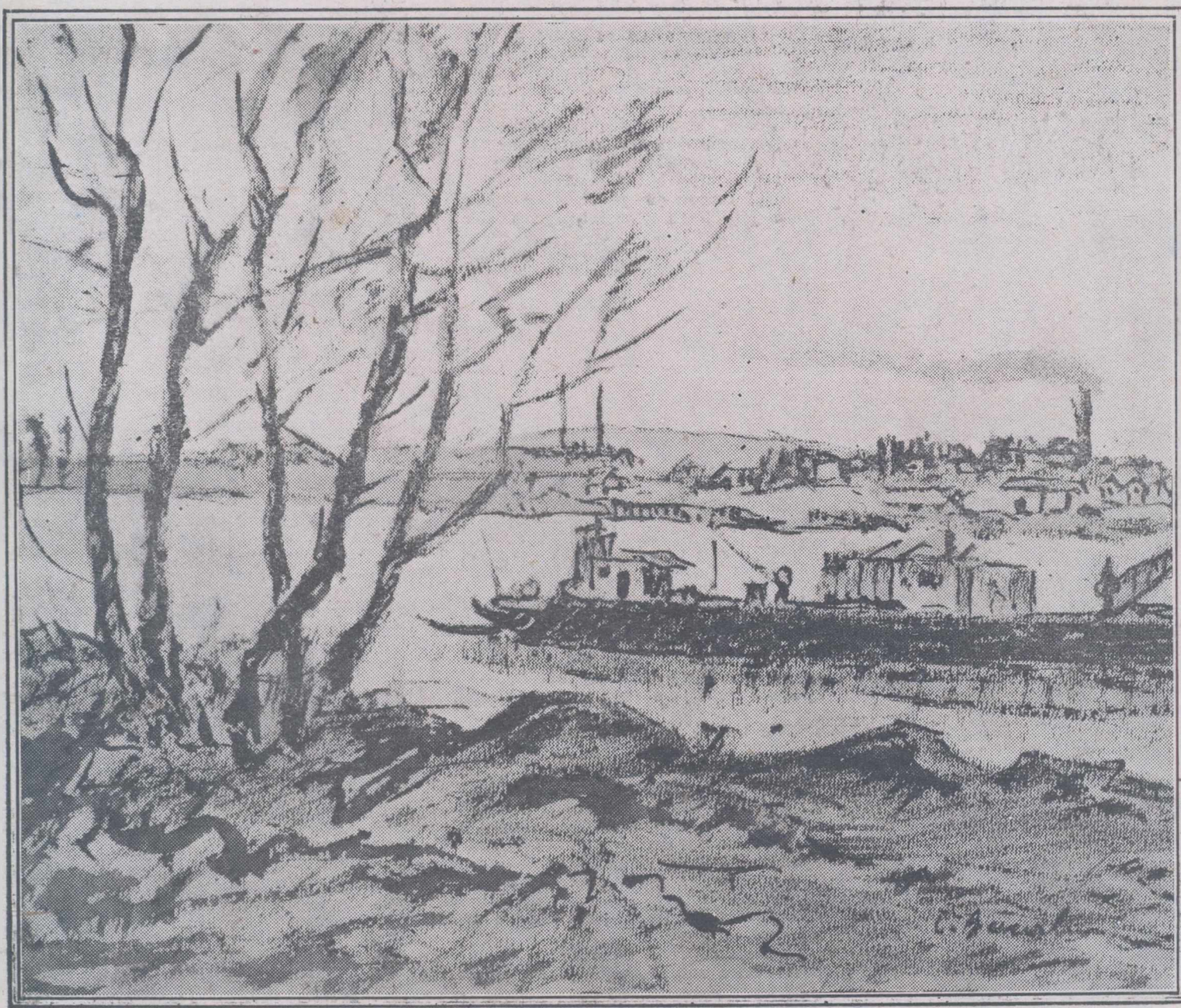
C. BACALU : PE DUNARE