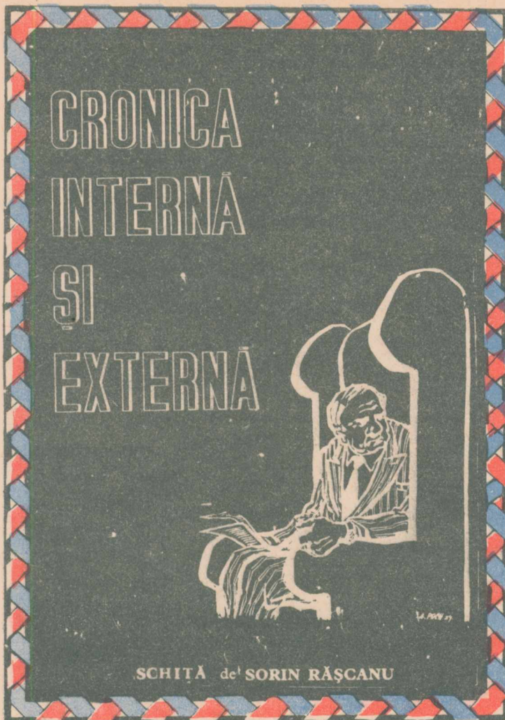
Ilustrații de A. POCH