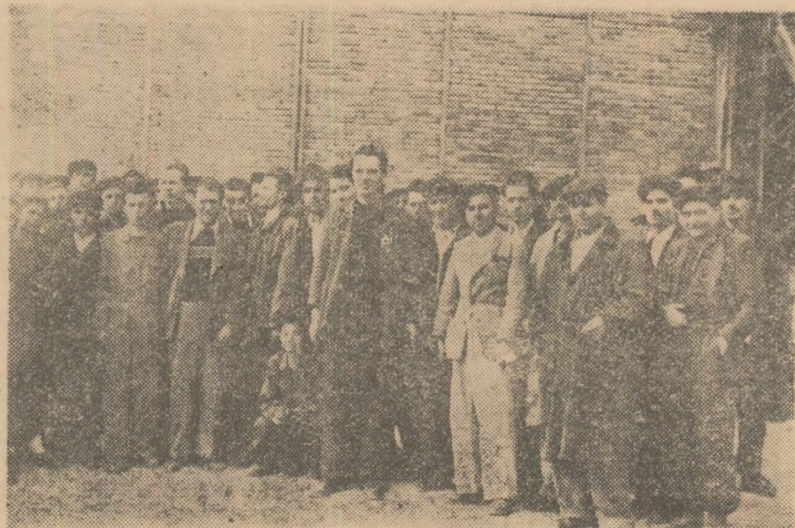
In foto: o parte din oțelarii hunedoreni, după mitingul din 6 aprilie

Fiecare tonă de oțel dată peste plan sintem convinși că va duce la sporirea numărului de mașini, utilaje și mașini unelte, necesare atît industriei cît și agriculturii noastre.