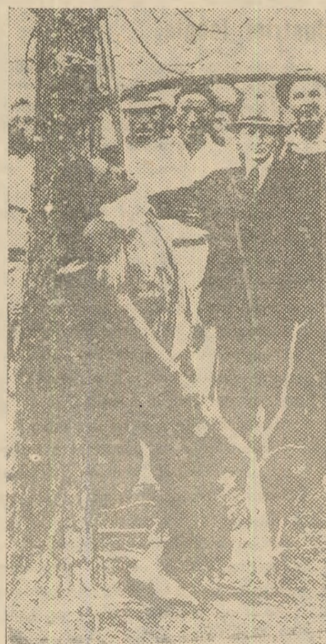
Linșajul unui negru în S.U.A.

În timpul celui de al doilea război mondial, la Hollywood a început să se vorbească chiar despre „egalitatea” dintre albi și cei de culoare. Aceasta, din motive similare celor din perioada corespunzătoare primului război mondial. Au fost produse