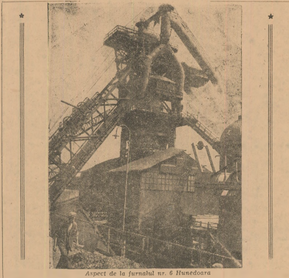
Aspect de la furnalul nr. 6 Hunedoara

Da, zi și noapte Hunedoara produce în cîntea zilei de 23 August