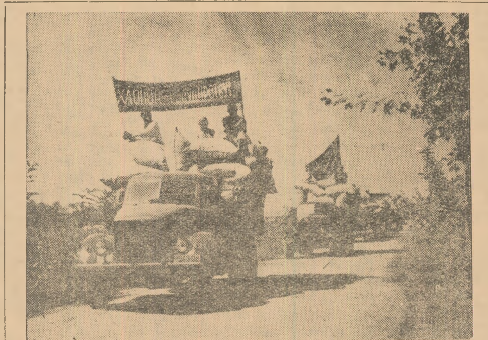
In raioanele din sudul republicii Tadjice, are loc culesul bumbacului. Punctele de stringerea bumbacului au primit primele sute de tone — materie de primă calitate superioară. In foto: Primul convoi cu bumbac din recolta nouă din colhozul Malenkov, raionul Kurgan

culeg de pe mari întinderi de livezi fructifere în fiecare an cantități considerabile de mere, pere, prune și alte fructe, cu gust plăcut. Într-o serie de gospodării se culeg acum de pe fiecare pâr cîte 250-400 kg. pere. Greutatea unora din pere atinge 300 grame și chiar mai mult.