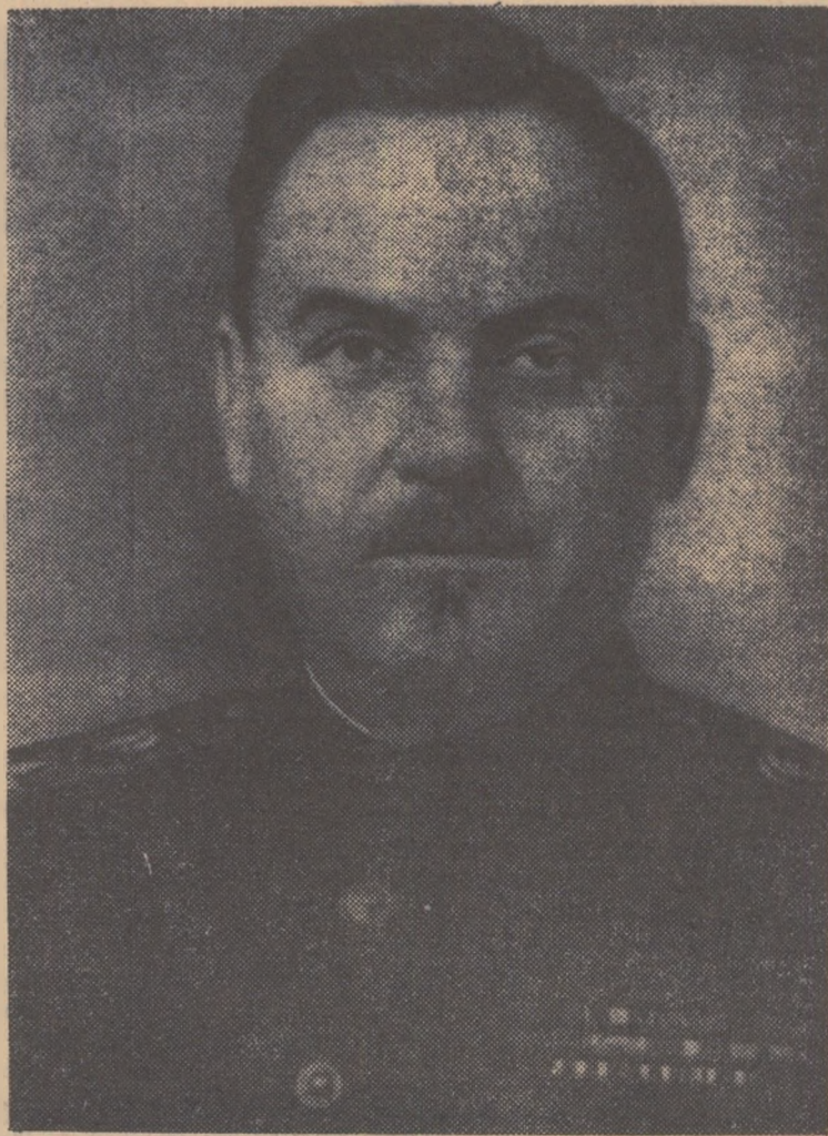
La 11 iunie 1955, tovarășul N. A. Bulganin, președintele Consiliului de Miniștri al U.R.S.S., membru în prezidiul Comitetului Central al P.C.U.S., a împlinit 60 de ani.